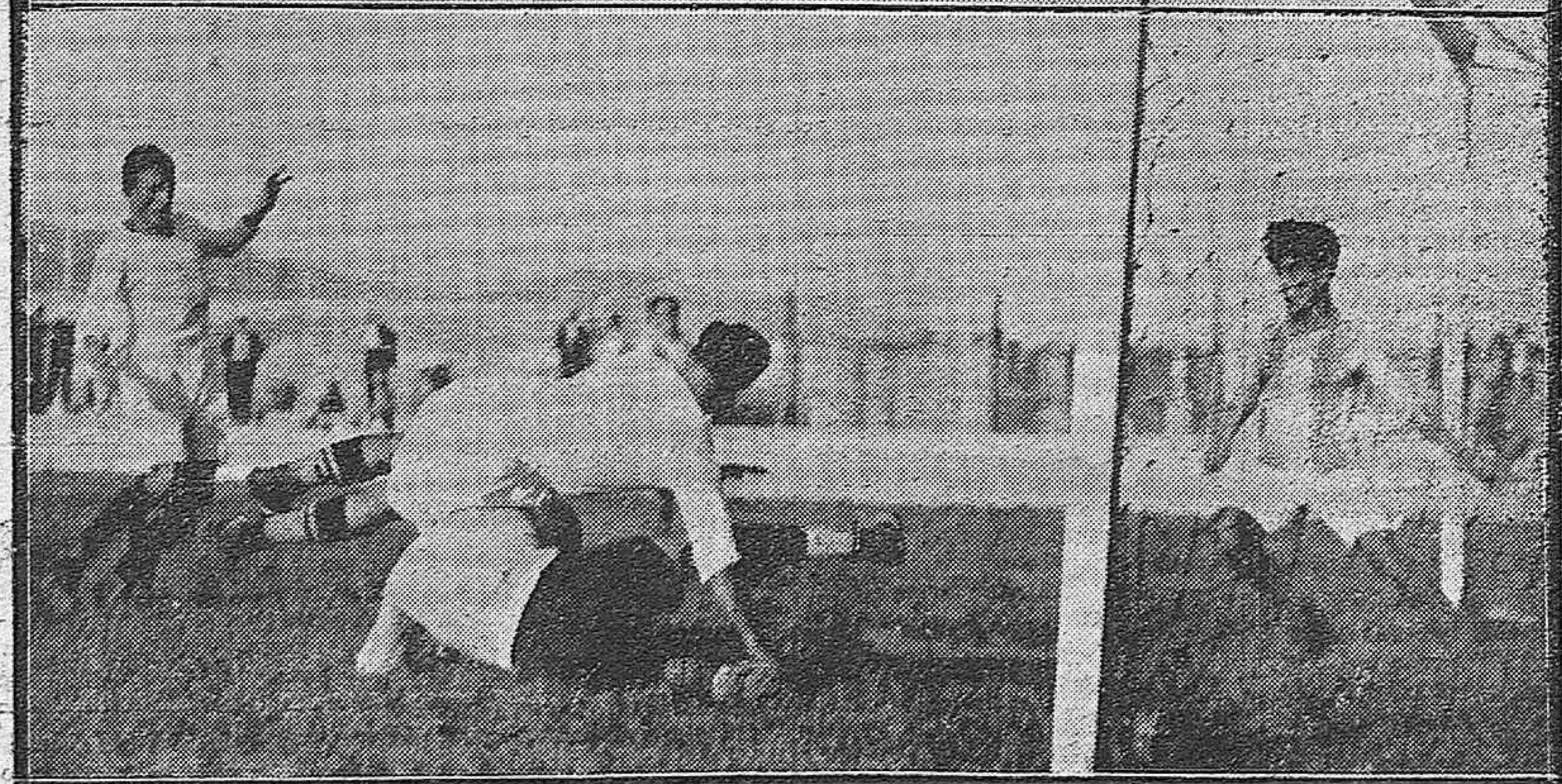
DE ACTUALIDAD MALAGUEÑA. — BELLÍSIMAS SEÑORITAS QUE PRESIDIERON LA CORRIDA DE LA ASOCIACIÓN DE LA PRENSA, ACOMPAÑADAS DE ALGUNOS MIEMBROS DE LA COMISIÓN CORDOBESA. — EL PARTIDO MALAGUEÑO-RACING: UN MOMENTO COMPROMETIDO ANTE LA META DEL RACING DE CÓRDOBA.