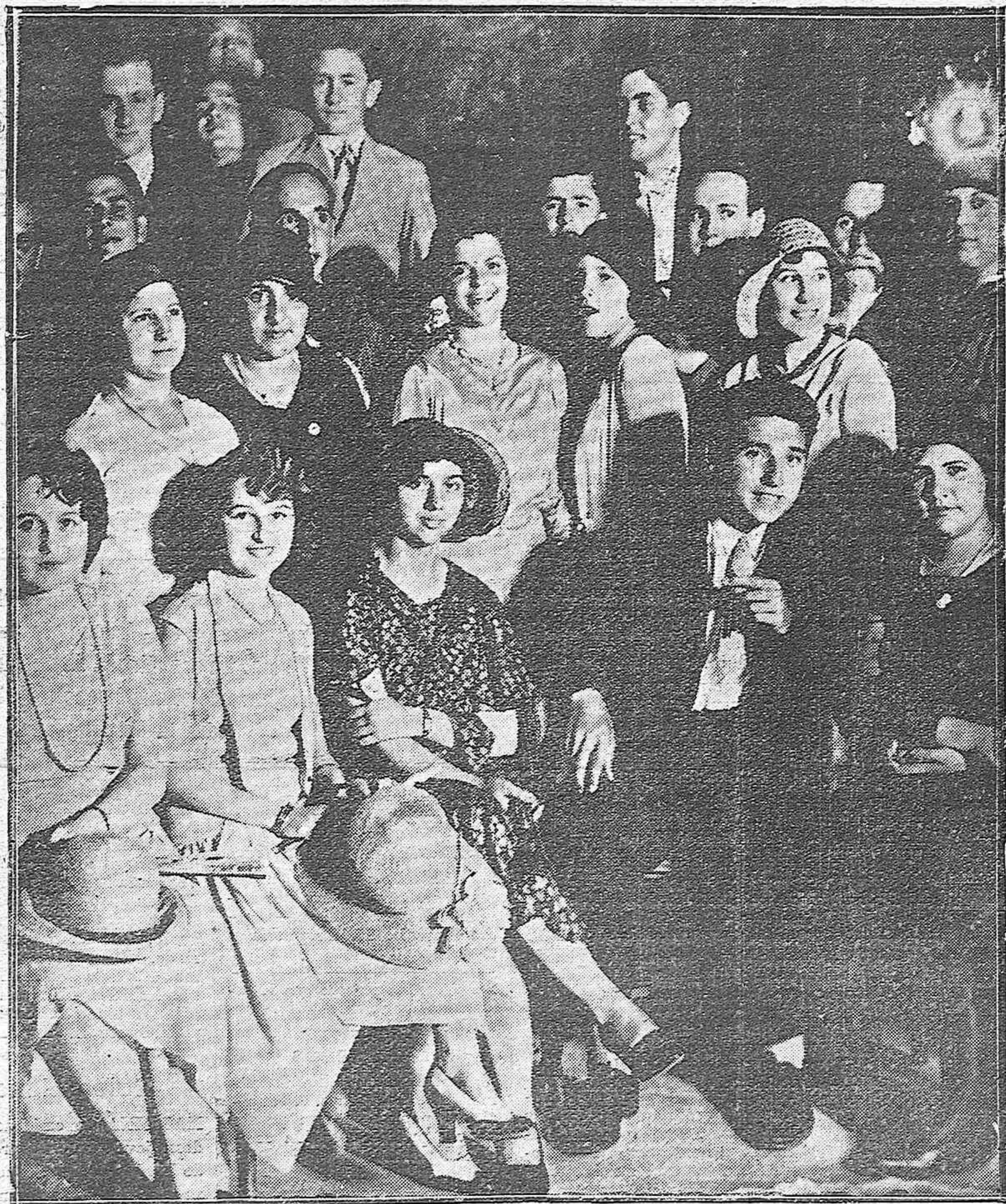
GRUPO DE BELLÍSIMAS SEÑORITAS EN LA CASETA DEL CÍRCULO DE LA AMISTAD, QUE GOZA DE GRAN ANIMACIÓN ESTE VERANO.