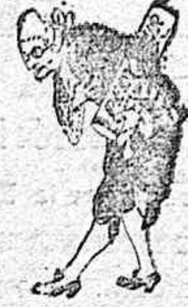
A los pies de Vd.