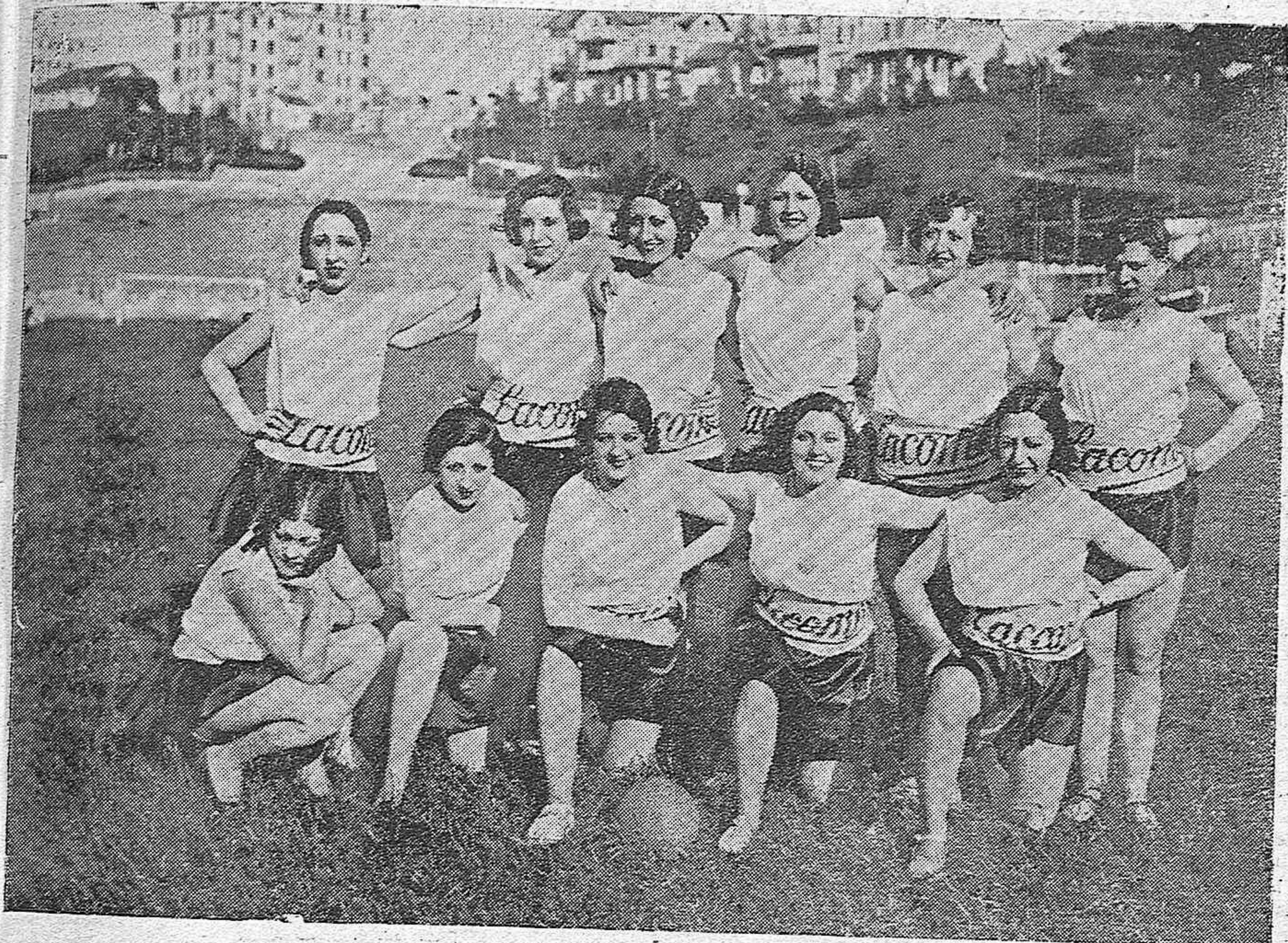
MADRID.—EQUIPO DE LINDAS ARTISTAS MADRILEÑAS, QUE SE PROPONEN CELEBRAR UN PARTIDO DE FOOT BALL A BENEFICIO DEL MONTEPIO DE ACTORES.