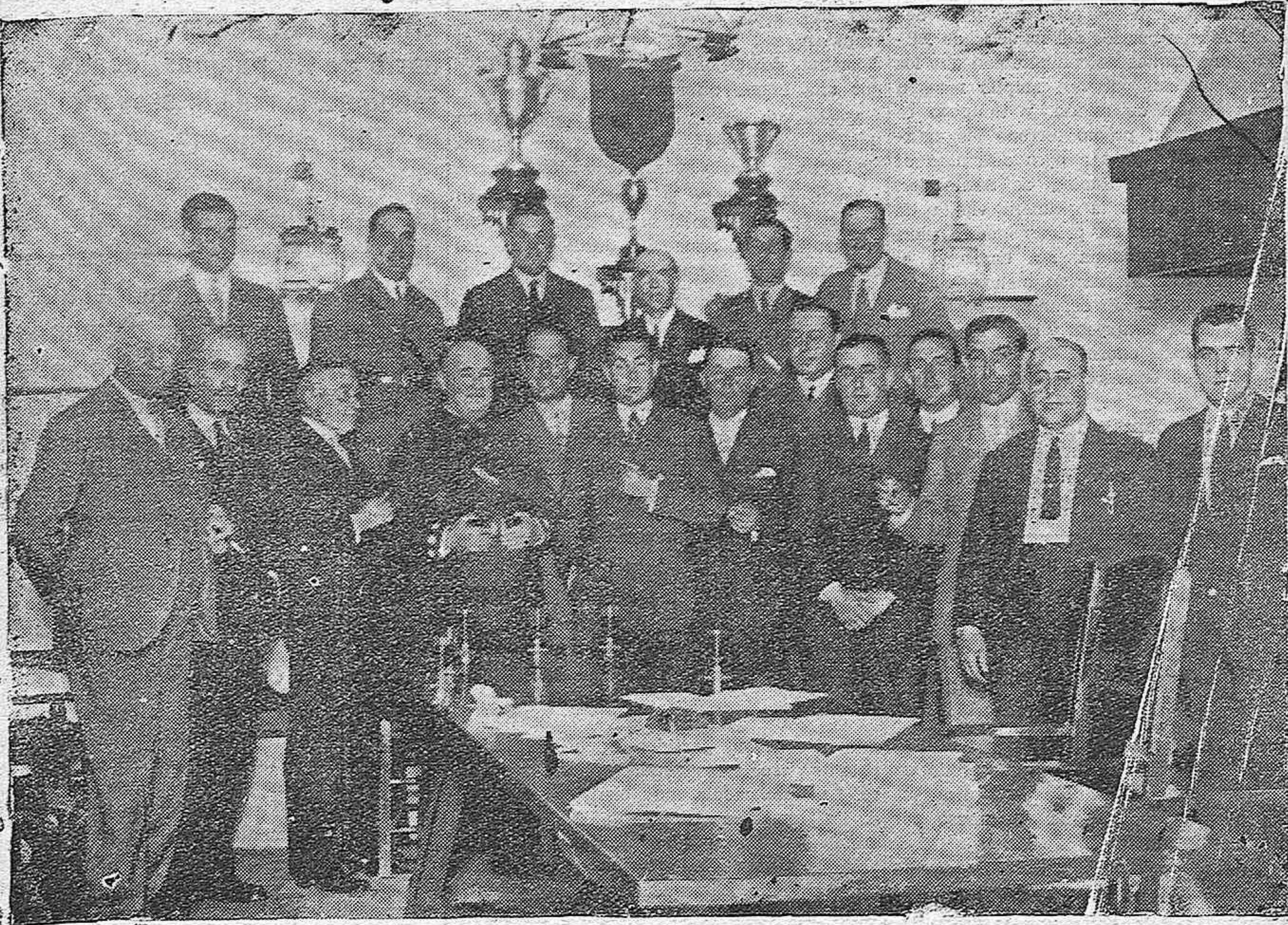
Grupo de concurrentes a la reunión convocada por el Club deportivo gáuguero cordobés, para la fijación de las fechas del campeonato provincial.