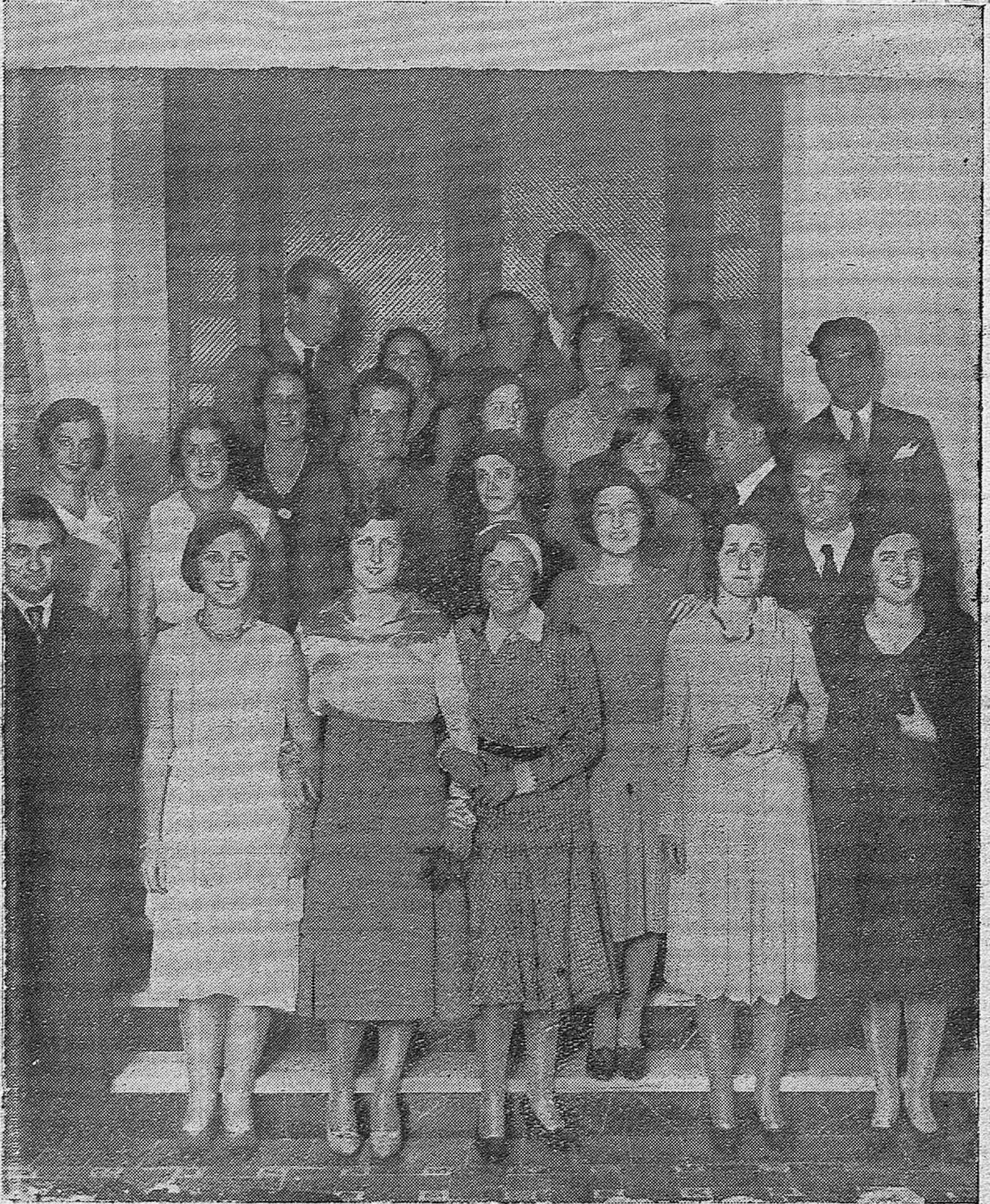
EN EL CIRCULO DE LA AMISTAD.—Los jueves aristocráticos. Grupos de distinguidas señoritas que asistieron a la reunión de sociedad y baile en el salón de música celebrado ayer en el aristocrático Círculo