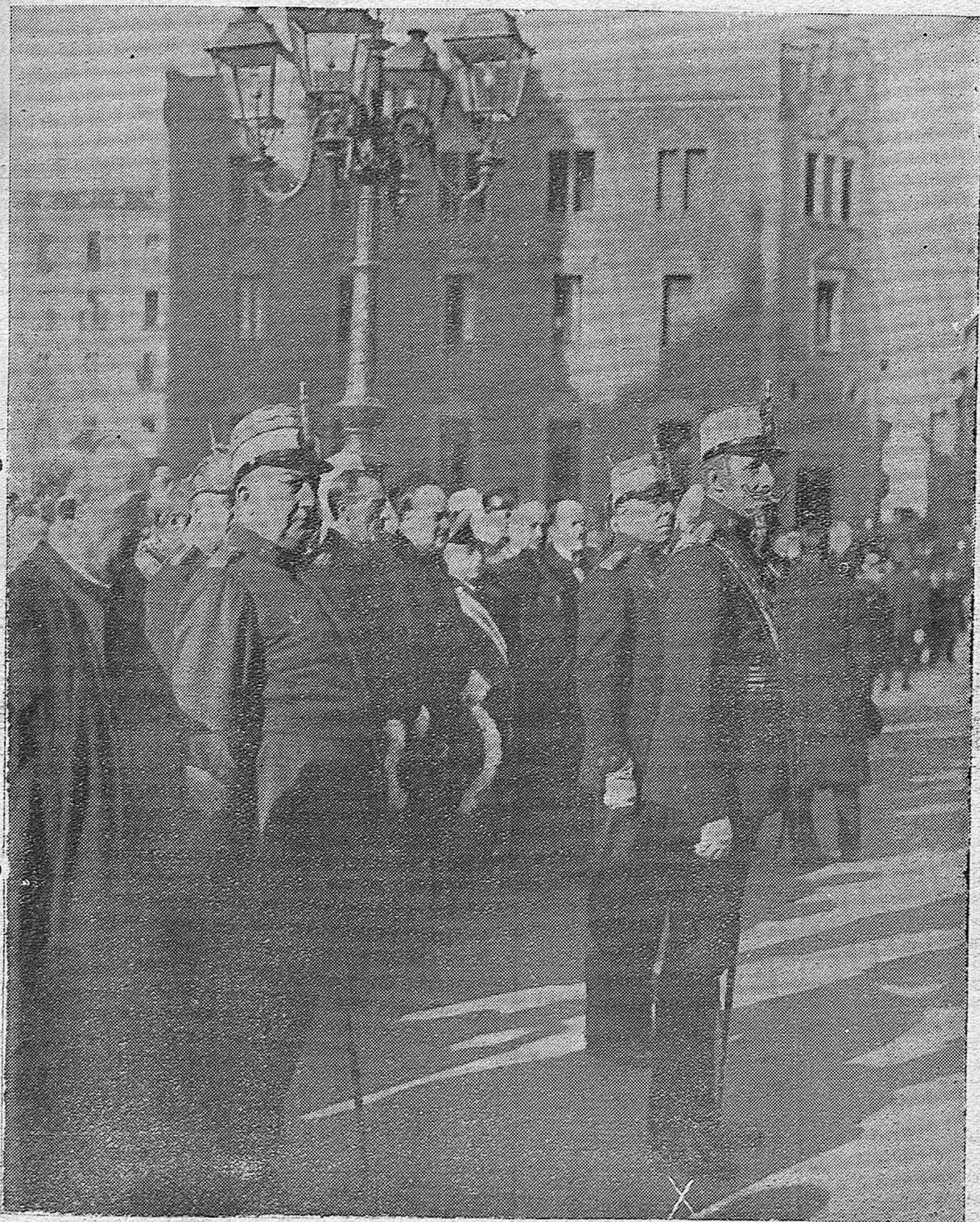
MADRID.—En San Francisco el Grande.—S. M. el Rey presenciando el desfile de las tropas despues de los solemnes funerales en el centenario de Simón Bolívar