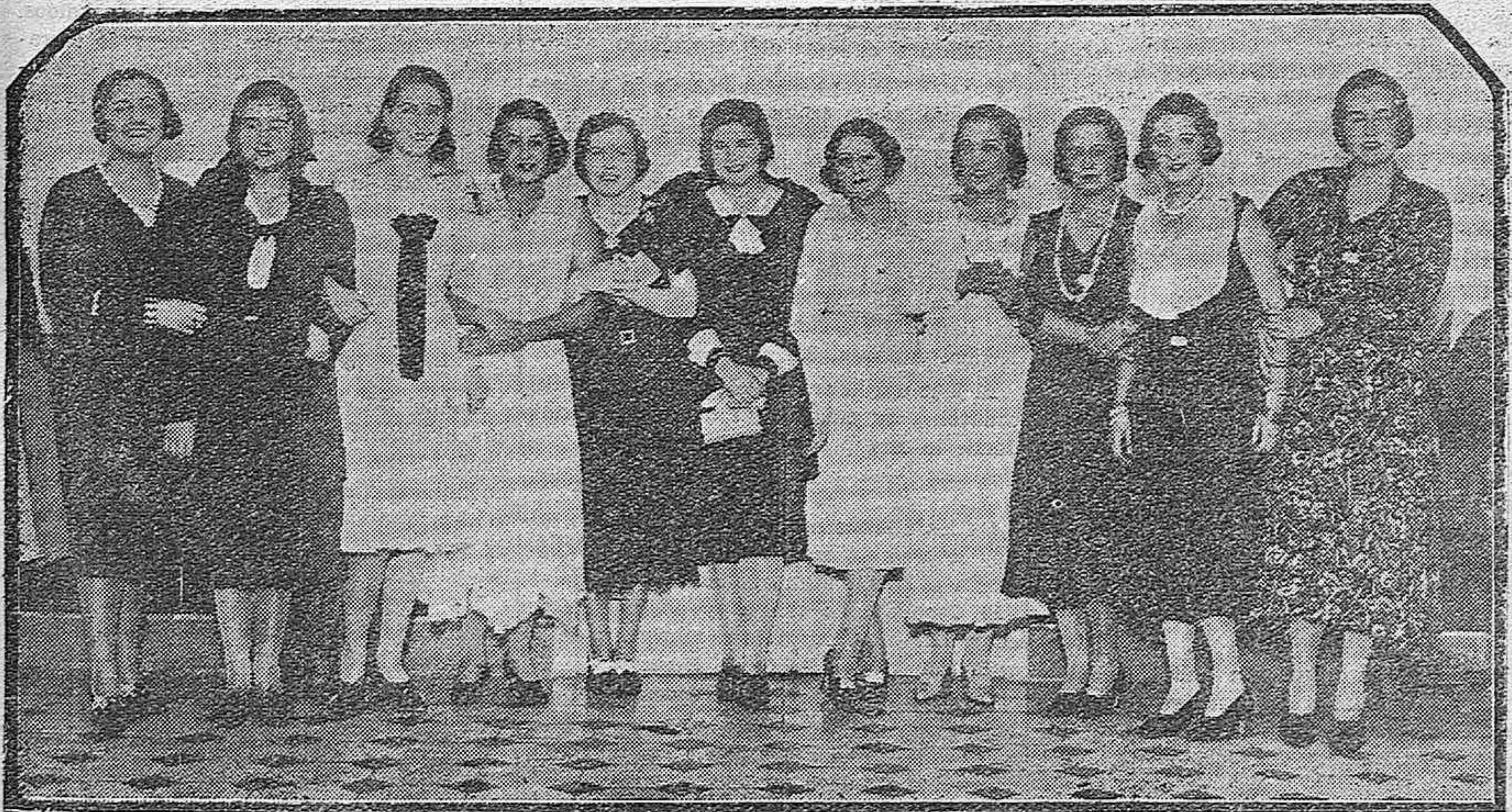
Grupo de bellas y distinguidas señoritas, concurrentes a la boda Urbano-Molina, celebrada ayer