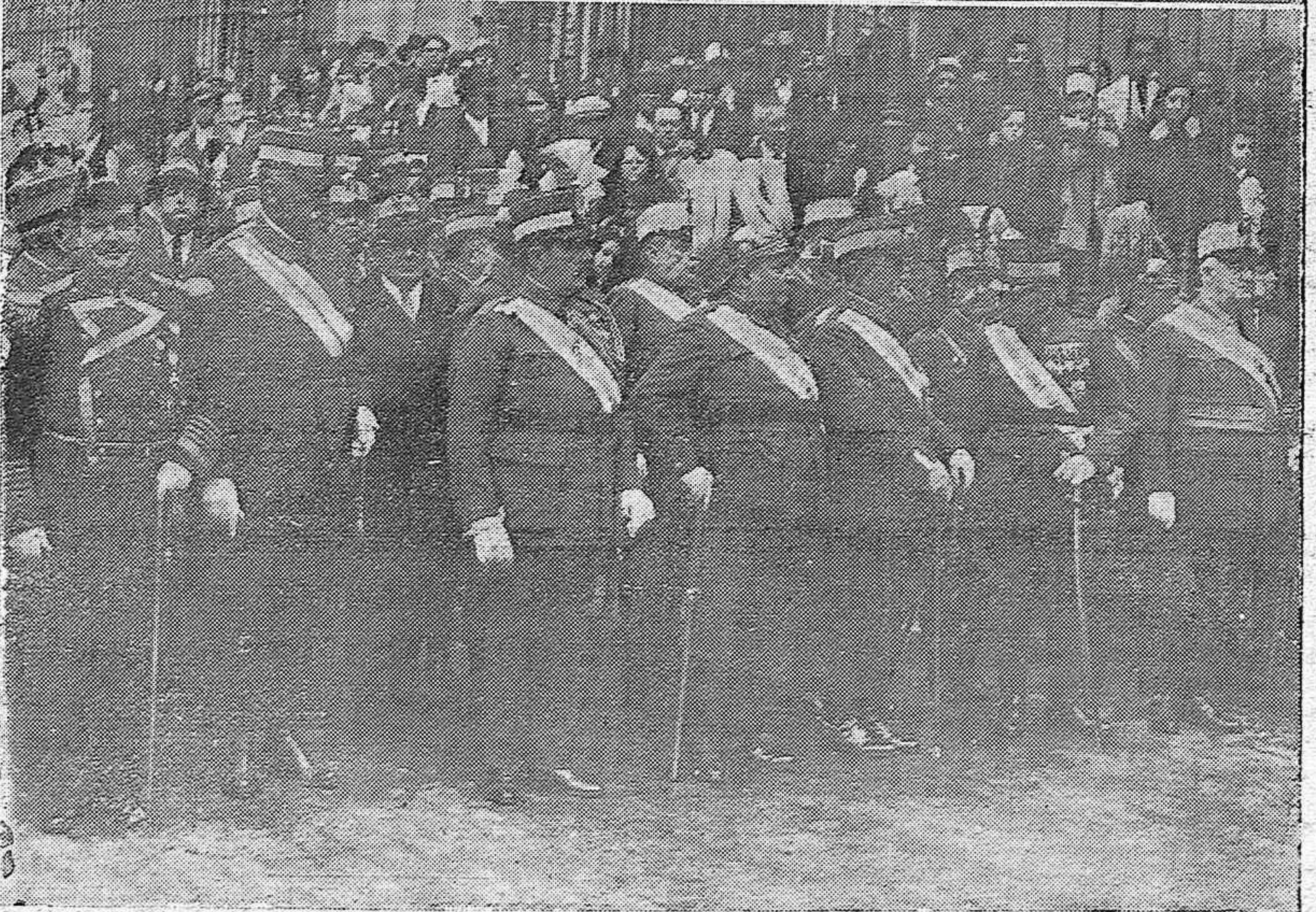
SEVILLA.—El elocuente orador don José María Peman en el brillante acto en el que pronunció un notable discurso.—Las autoridades militares de Sevilla a la salida de la fiesta religiosa celebrada ayer en el templo del Salvador.