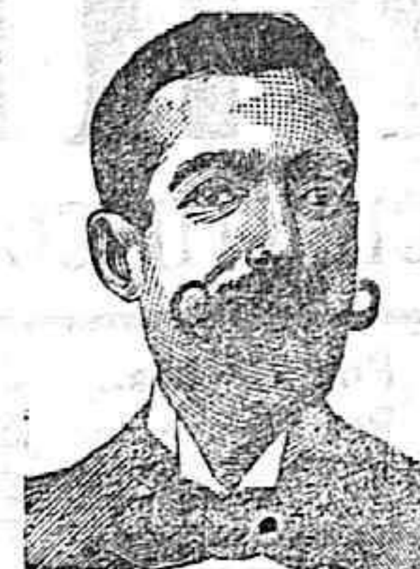
A. SALVATI COSTANZI Calle Diputación 435 BARCELONA

Los precios de los demás artículos, en la misma relación.—A los pobres se les facilitarán los medicamentos al costo.