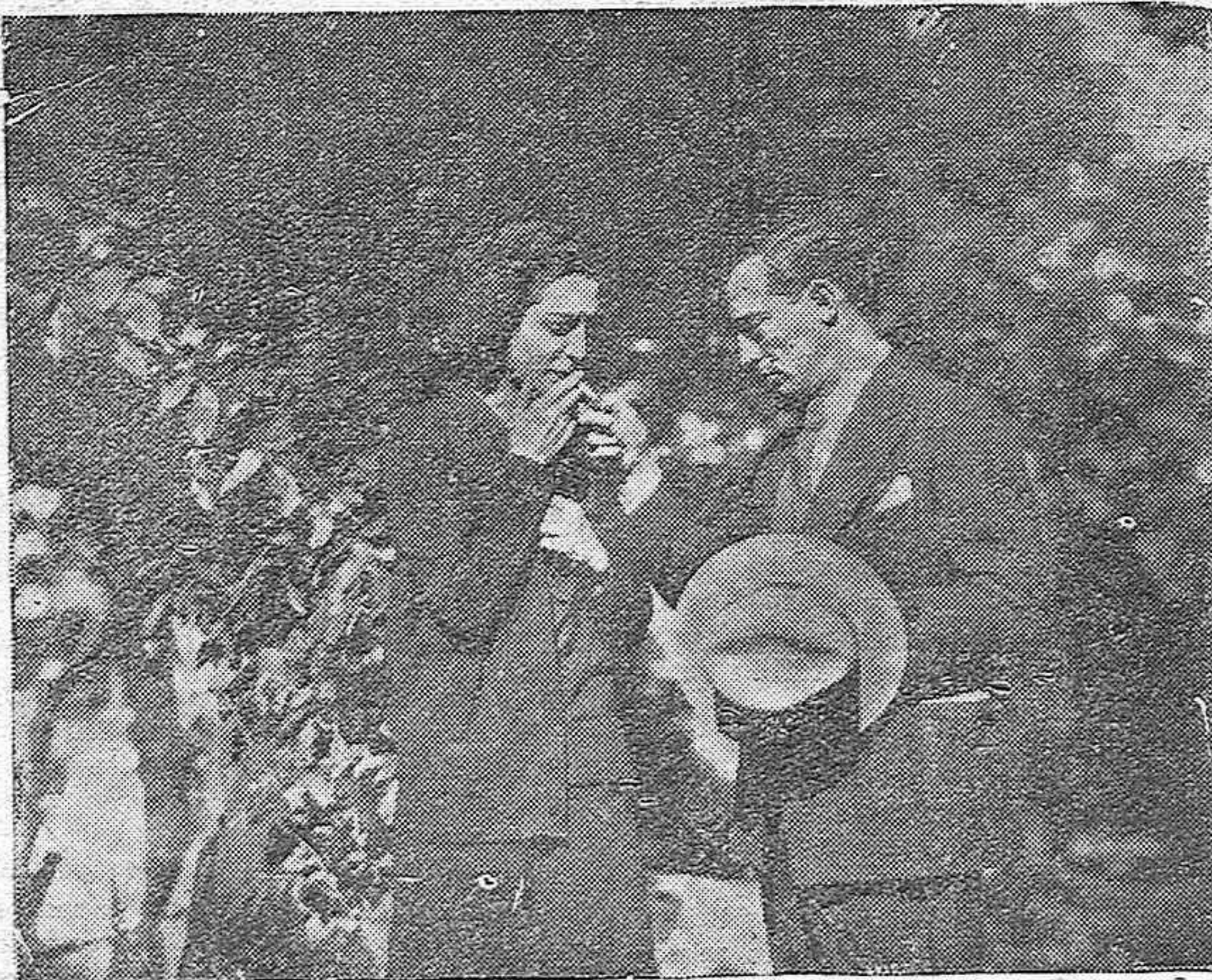
En su paseo por el Bosque de Bolonia, durante su reciente estancia en París, el gran Buster Keaton (Pamplinas) enciende el cigarrillo de una muchacha que le reconoce

Después de Jakie Coogan ha conocido el éxito brillante de las grandes "estrellas" llevando de oro a toda su familia, muchos padres imaginan que sus hijos, también poseen las cualidades fotogénicas del joven protagonista americano. De este modo, el "Casting" (Departamento encargado de con-