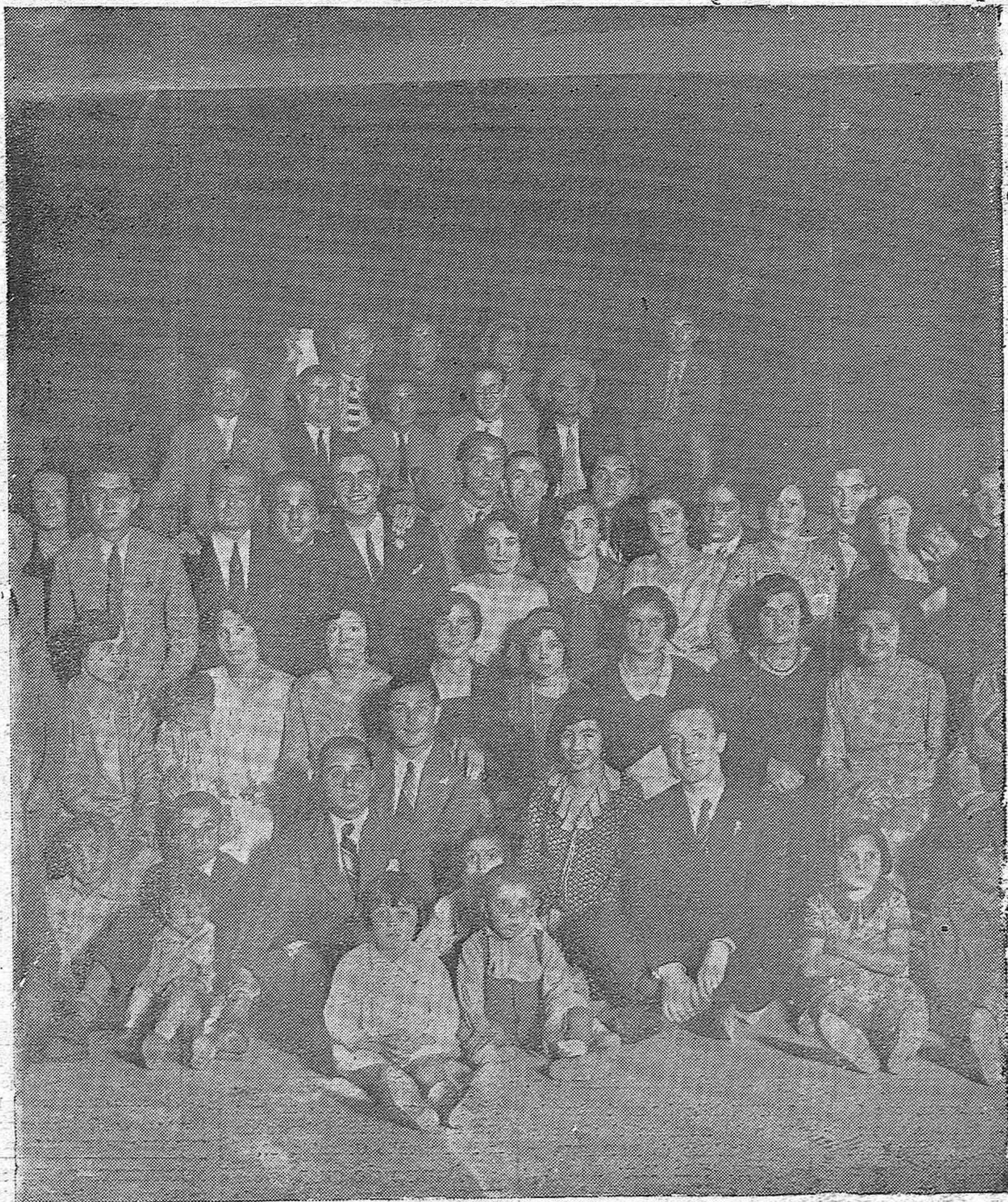
UNA VERBENA.—JOVENES QUE ASISTIERON A LA FIESTA ANDALUZA CELEBRADA EN EL CARRIO DE SAN CAYETANO