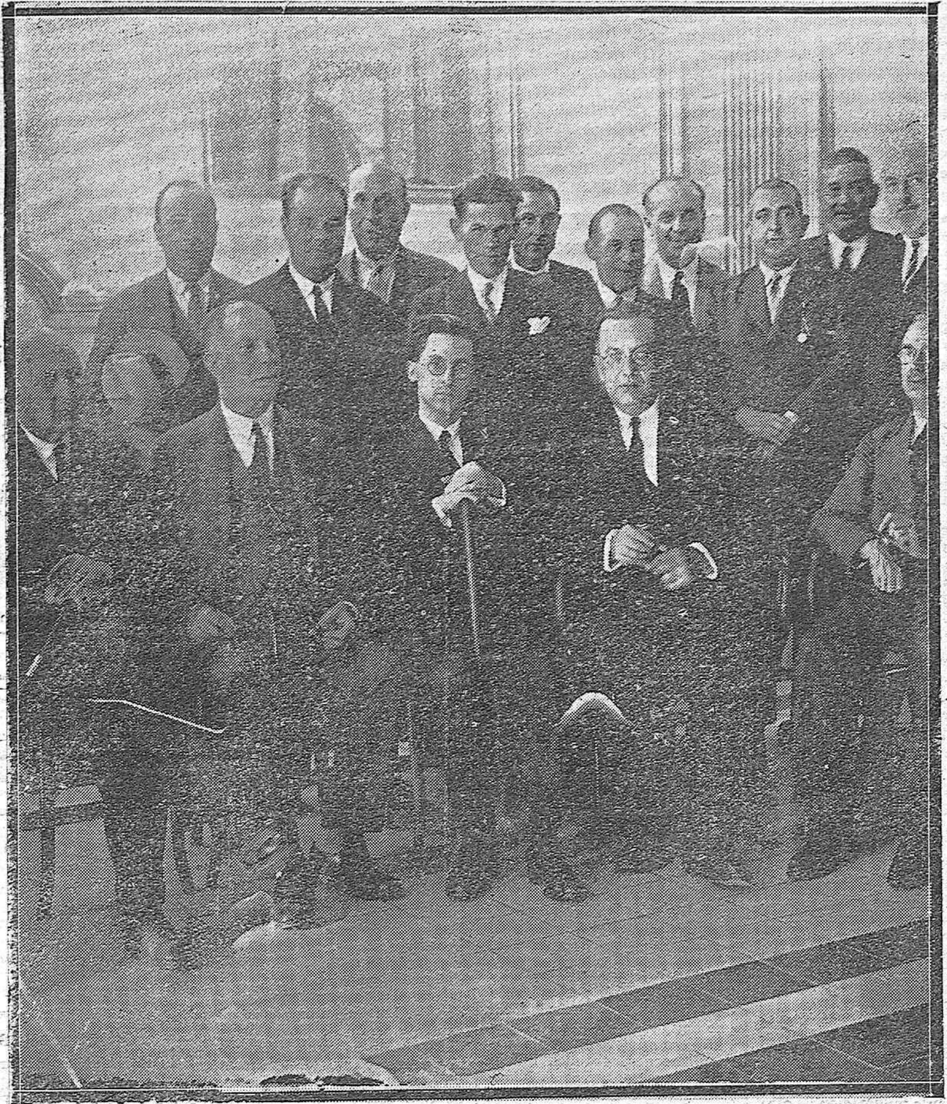
LA FIESTA DEL MAESTRO.—GRUPO DE INSPECTORES Y MAESTROS DESPUÉS DEL BANQUETE CELEBRADO AYER PARA CELEBRAR LA FESTIVIDAD