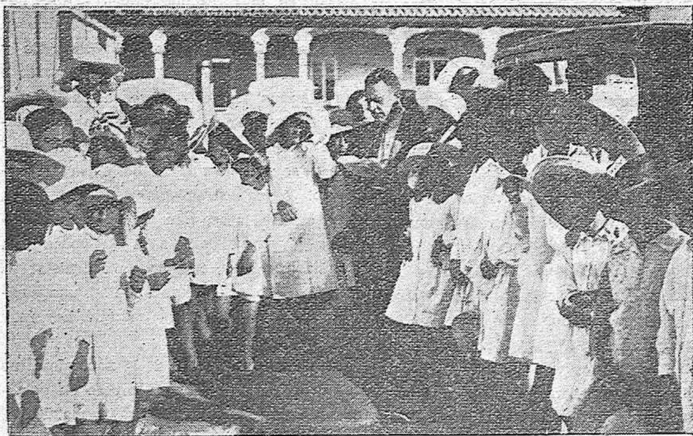
DE LA COLONIA ESCOLAR.—Nuestro compañero Adolfo ha sorprendido este momento de emoción en que las niñas cordobesas reciben las cartas que les hablan del cariño de su familia y del deseo de verlas.