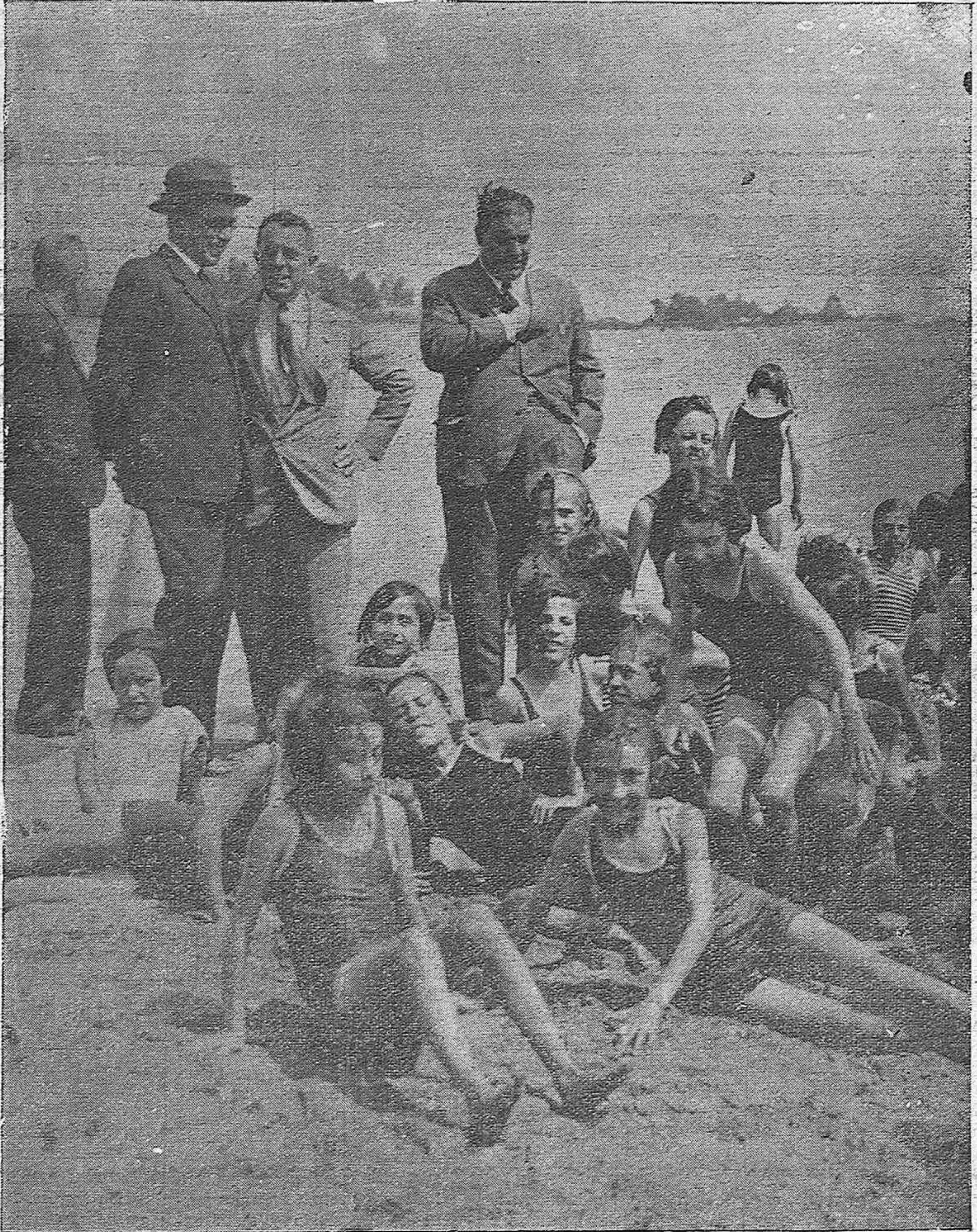
LA COLONIA ESCOLAR.—A la orilla del tranquilo mar, en la serena playa de Torremolinos, las niñas de la colonia escolar cordobesa descansan de su bulliciosa inmersión en las aguas