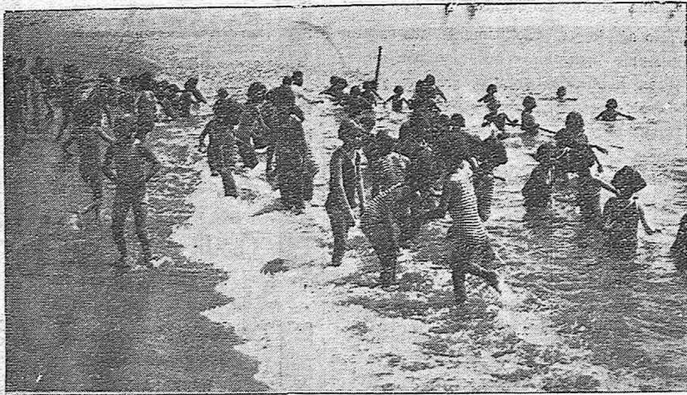
DE LA COLONIA ESCOLAR.—Disfrutando de la plena caricia del agua y del sol las niñas gozan lo indecible

OCASION: Retales de géneros traje de caballero, propósito para pantalones, americanas o trajes de niño en EL METRO a precios de liquidación.