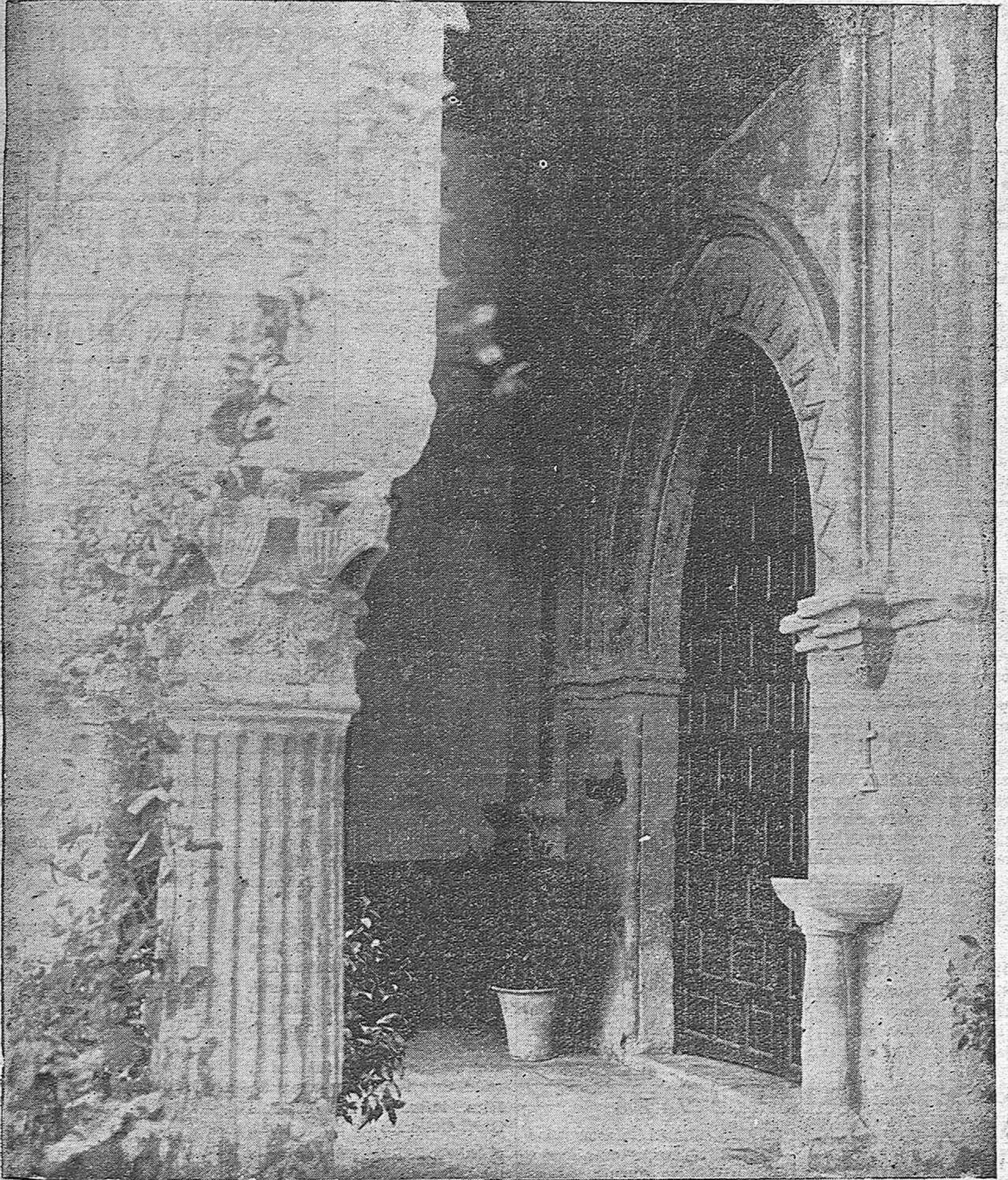
La capilla de San Bartolomé, en el Hospital de Agudos, que ha sido cerrada al culto, al declararla el Estado monumento nacional.