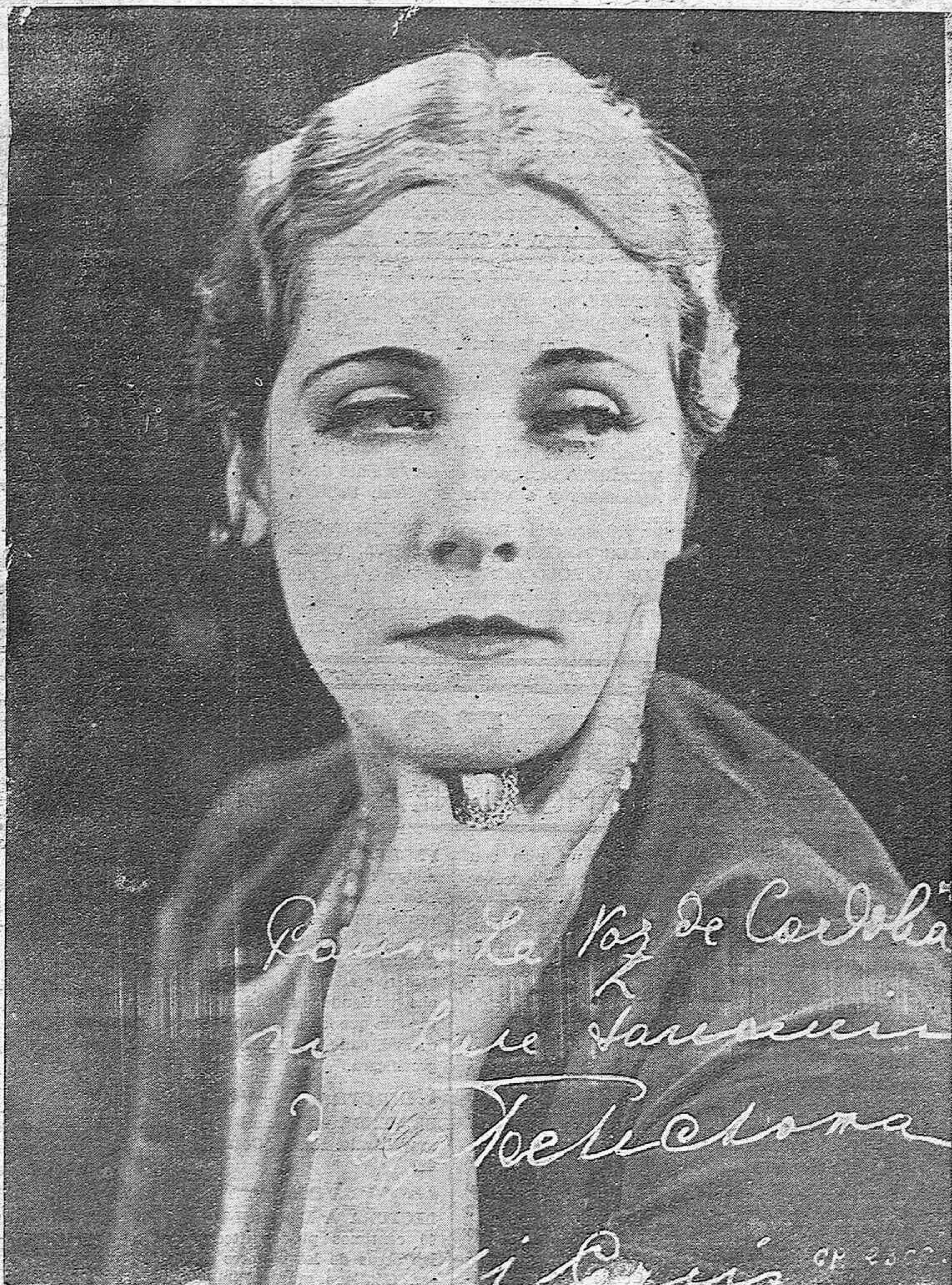
ARTISTAS DE LA PANTALLA.—La célebre trágica rusa Olga Yschechowa, protagonista de varias importantes películas que ha tenido la gentileza de dedicarnos esta fotografía.