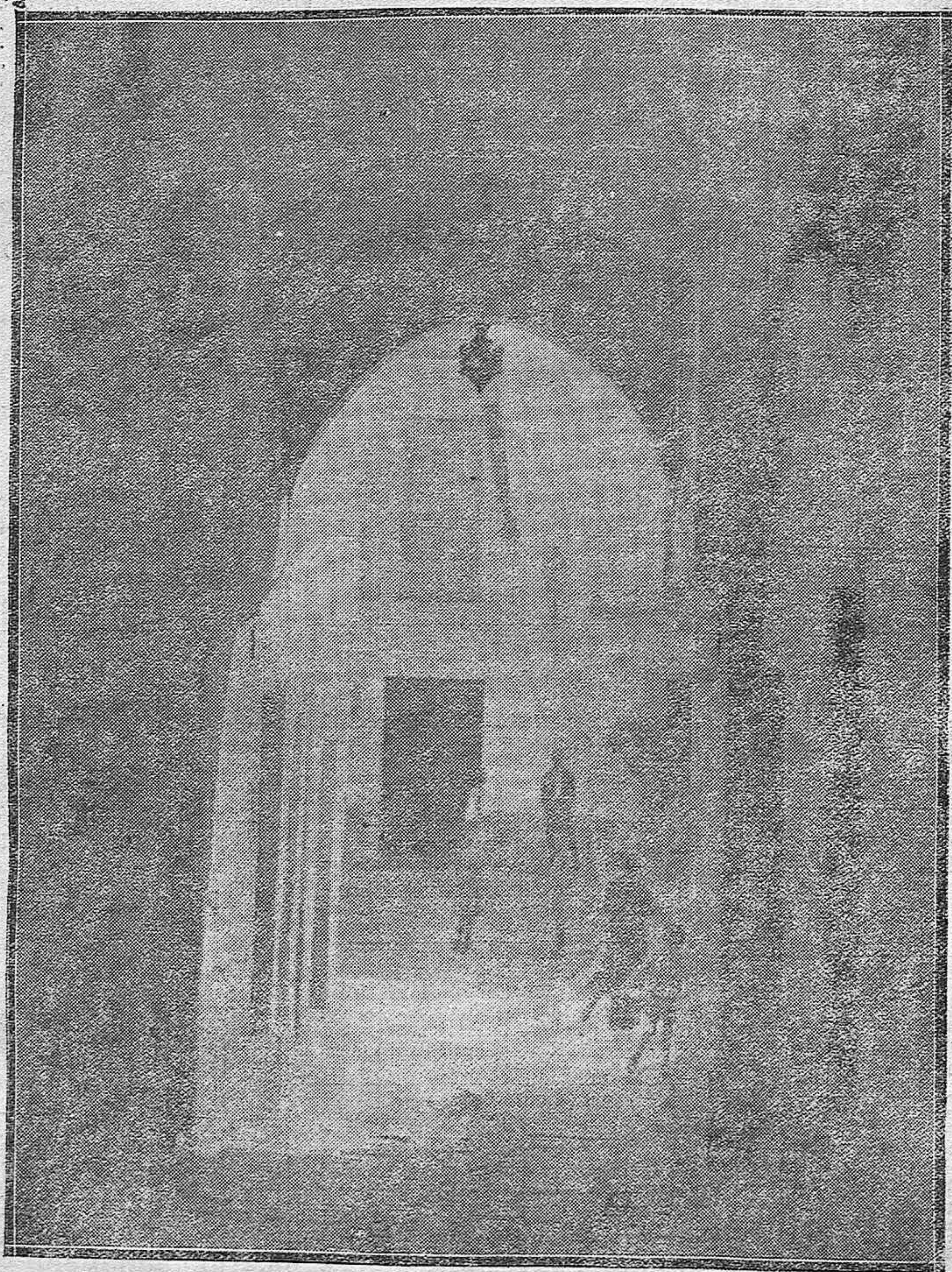
RINCONES TÍPICOS DE CÓRDOBA.---El arco del Portillo visto desde la esquina de la calle de las Cabezas.