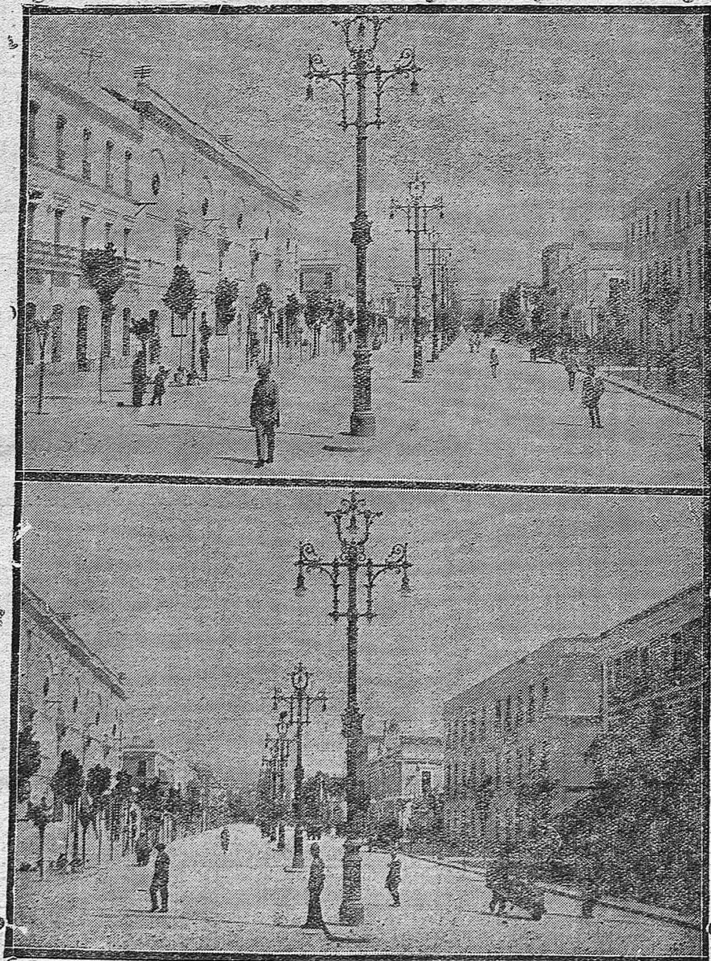
LAS REFORMAS DE CÓRDOBA.---Dos aspectos del Gran Capitán, desde distintos puntos de vista, después de convertido en hermosa avenida.