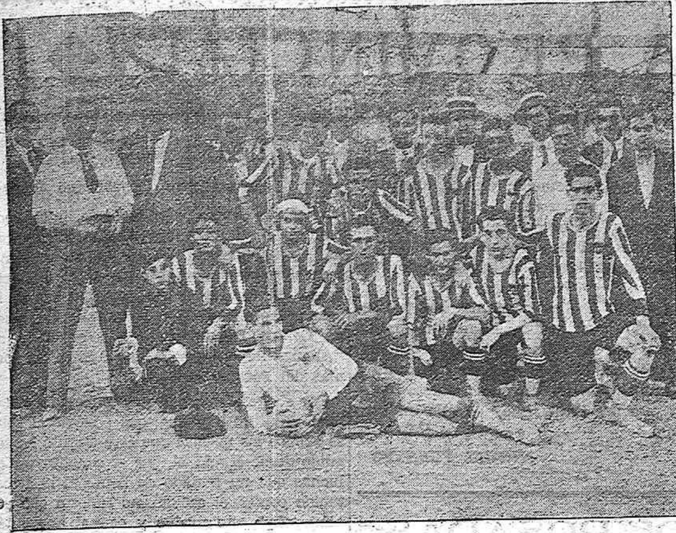
Los jugadores de La CULTURAL DEPORTIVA y directivos. Este once venció el pasado domingo al Racing Club Pontanés, ganando una hermosa copa de plata