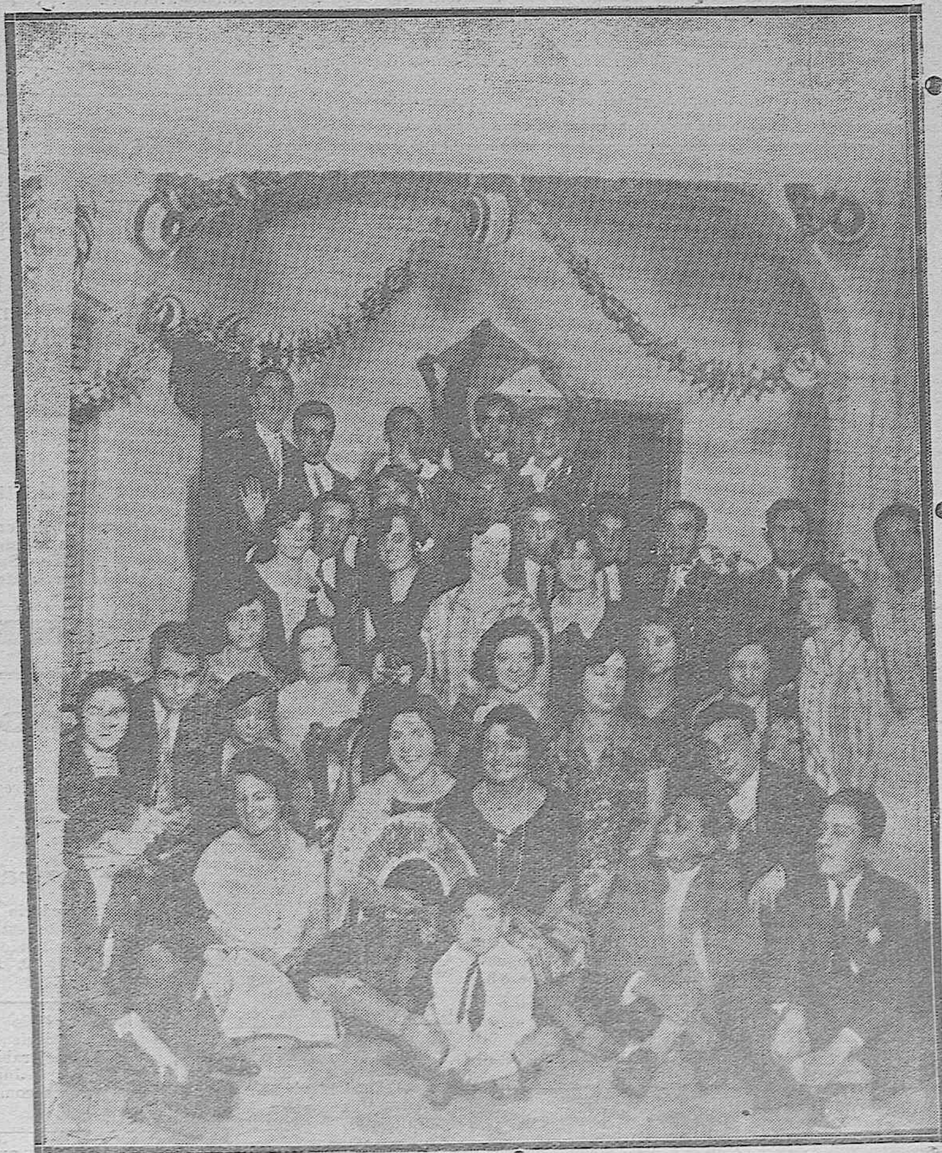
Bellas señoritas y distinguidos jóvenes que asistieron a la verbená celebrada en el domicilio de los señores de Fonseca.