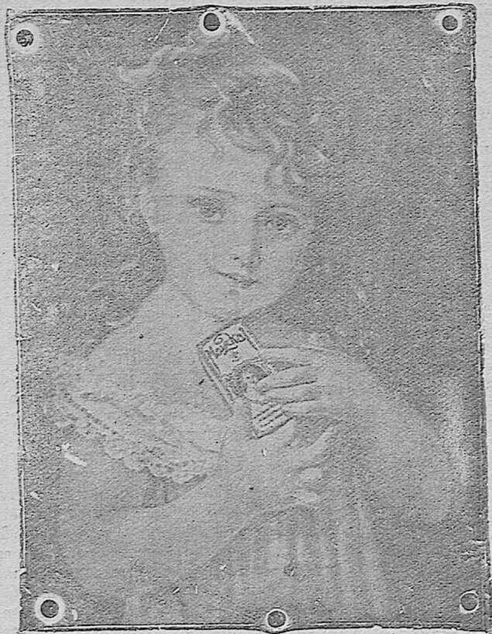
"La niña del Maizkal"