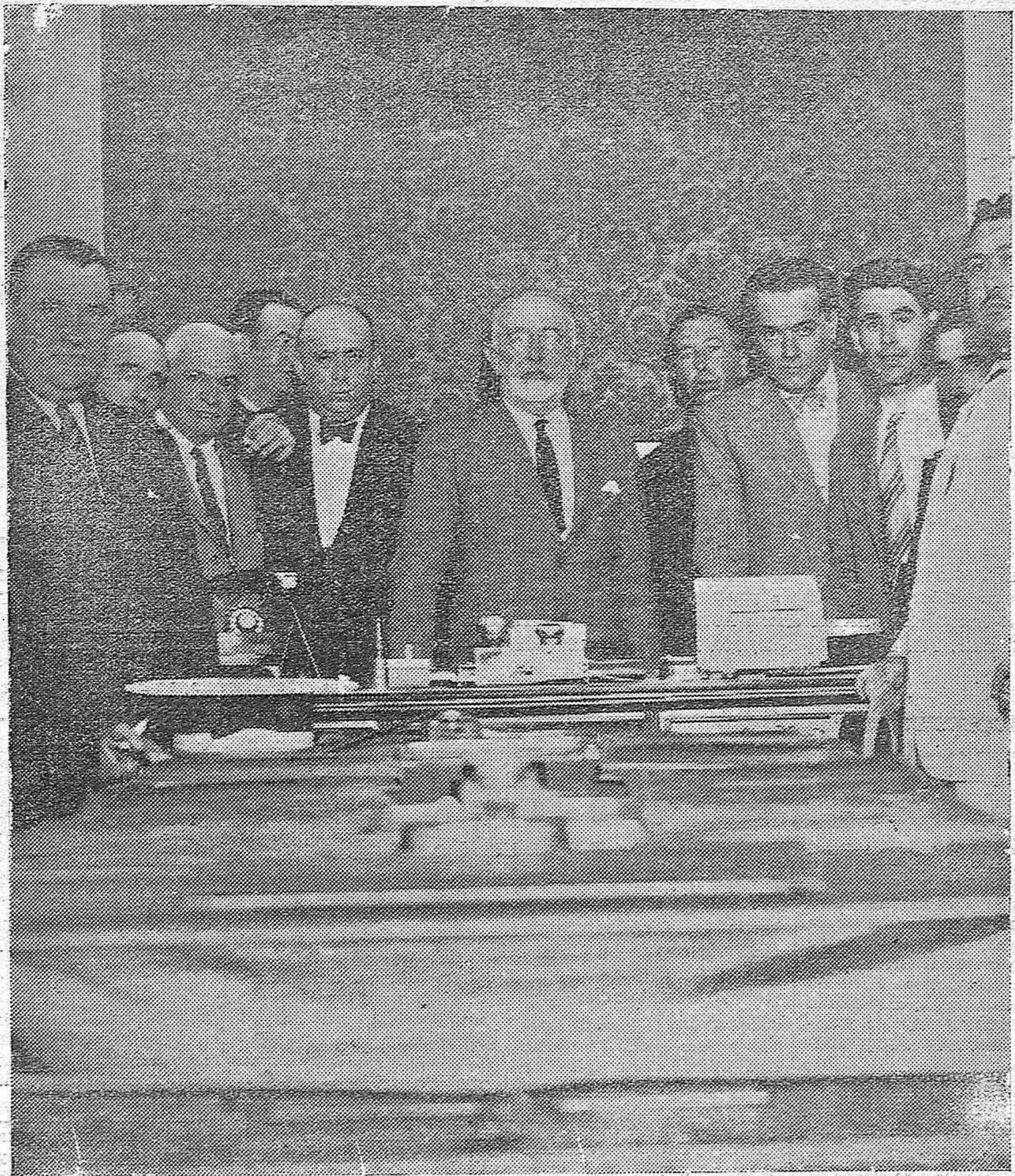
UNA REUNION IMPORTANTE.—Presidencia de la Asamblea de alcaldes de la provincia, celebrada en la Diputación provincial para buscar soluciones a la grave crisis de trabajo