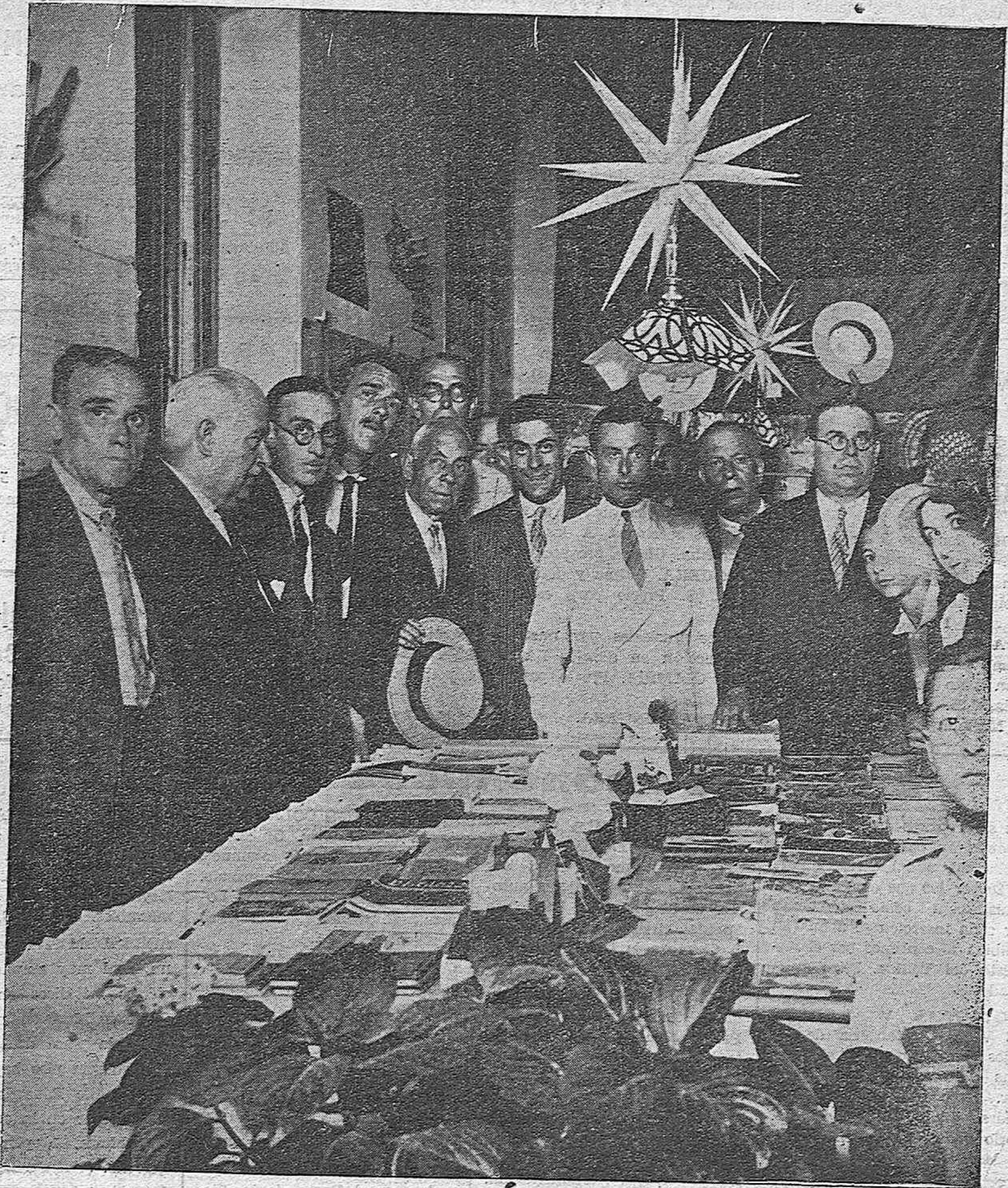
EN LA ESCUELA DE LA CALLE SARAVIA.—Interesante exposición de trabajos escolares de los alumnos normalistas y niños de la graduada aneja, inaugurada anoche.