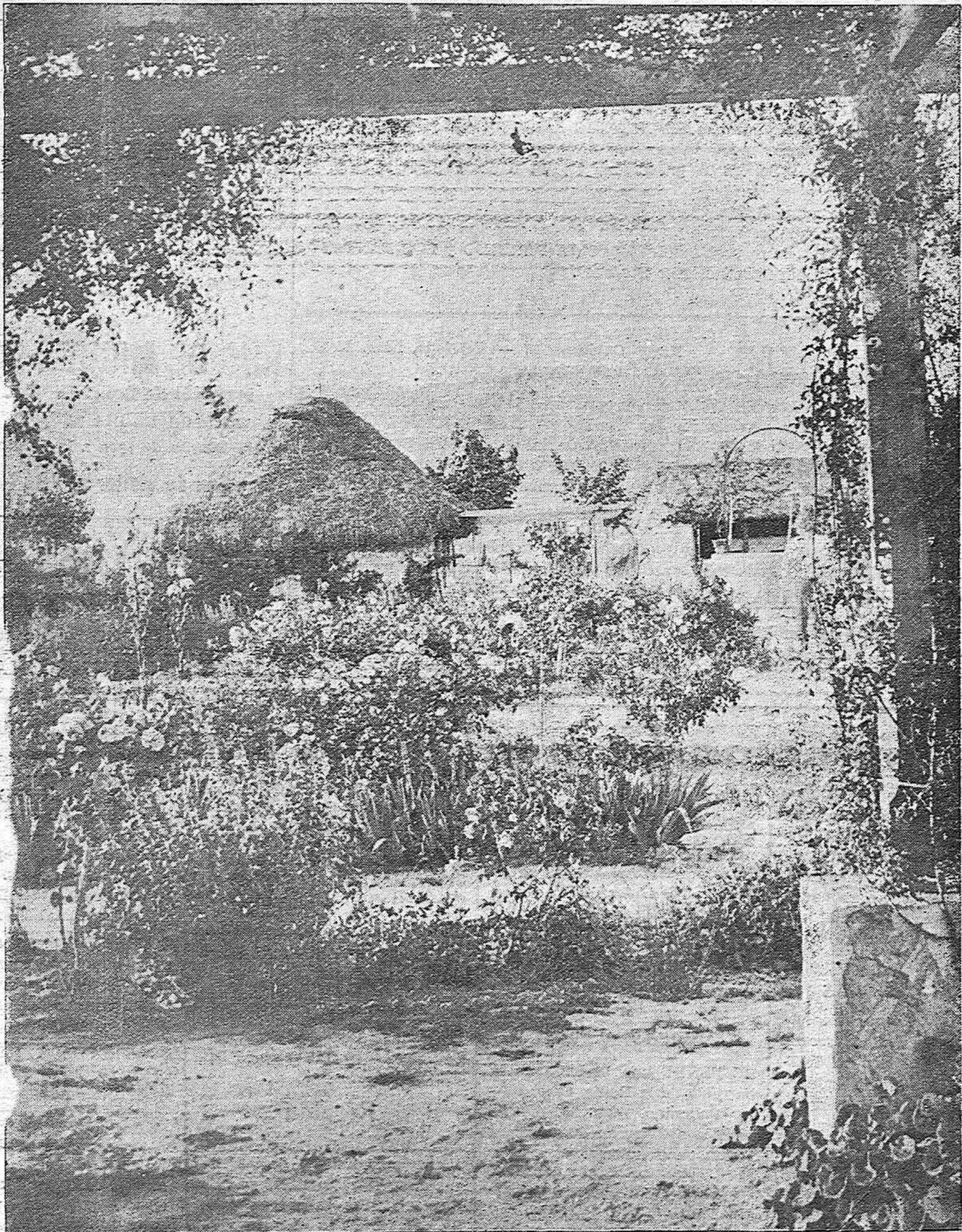
PAISAJES ARTISTICOS DE CORDOBA.—Bella vista obtenida por nuestro fotógrafo del Campo de Deportes del 8.º Regimiento de Caballería, sito en las proximidades de la Electromecánica