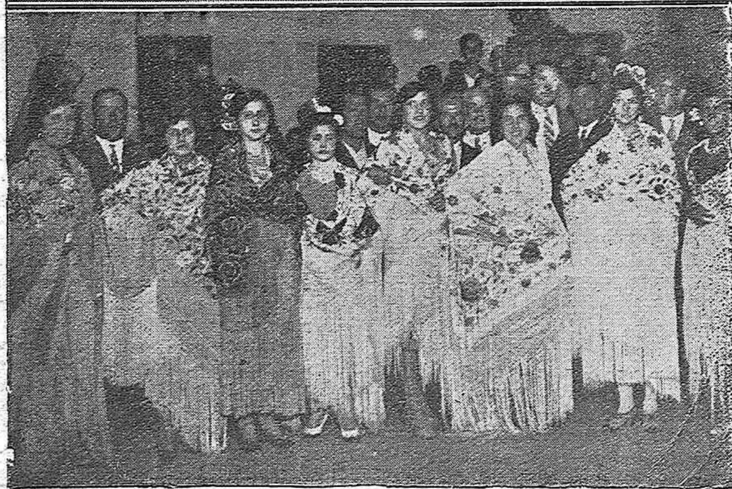
LAS FIESTAS DE LA ELECTROMECHANICA.—Bellas señoritas que al frente de la tómbola procuran allegar fondos para los Grupos Escolares.—Señoritas que fueron premiadas en el concurso de mantones celebrado anoche.

Clínica R. Castellano PULMÓN Y CORAZÓN :: RAYOS X CONSULTA, DE 11 A 4 PLAZA DEL ANGEL, NÚMERO 1