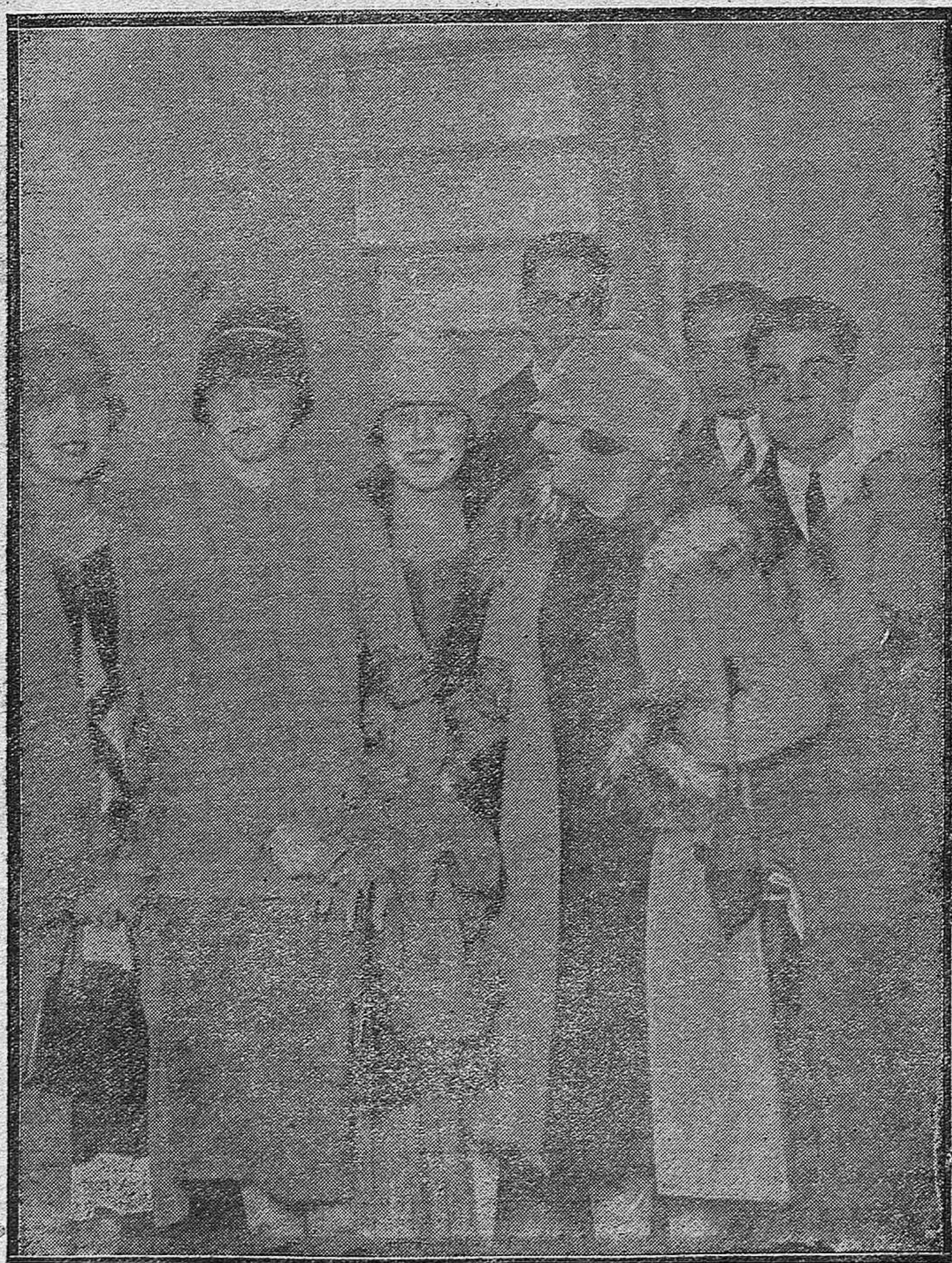
INAUGURACIÓN DEL CINEMATÓGRAFO BENÉFICO.—Grupo de distinguidas y elegantes jóvenes de la buena sociedad cordobesa que asistieron al acto.