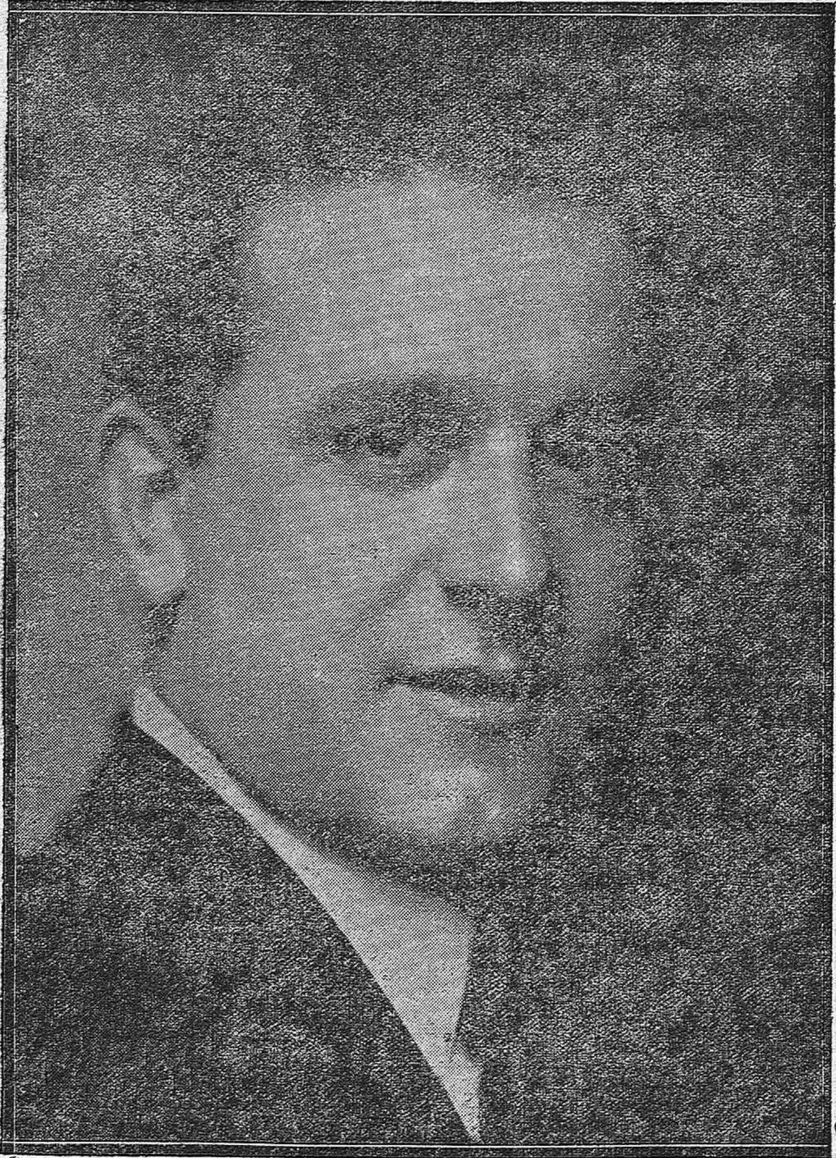
El notable tenor egábrense Antonio Ocaña y Ocaña, que ha alcanzado un clamoroso triunfo en nuestro Gran Teatro.