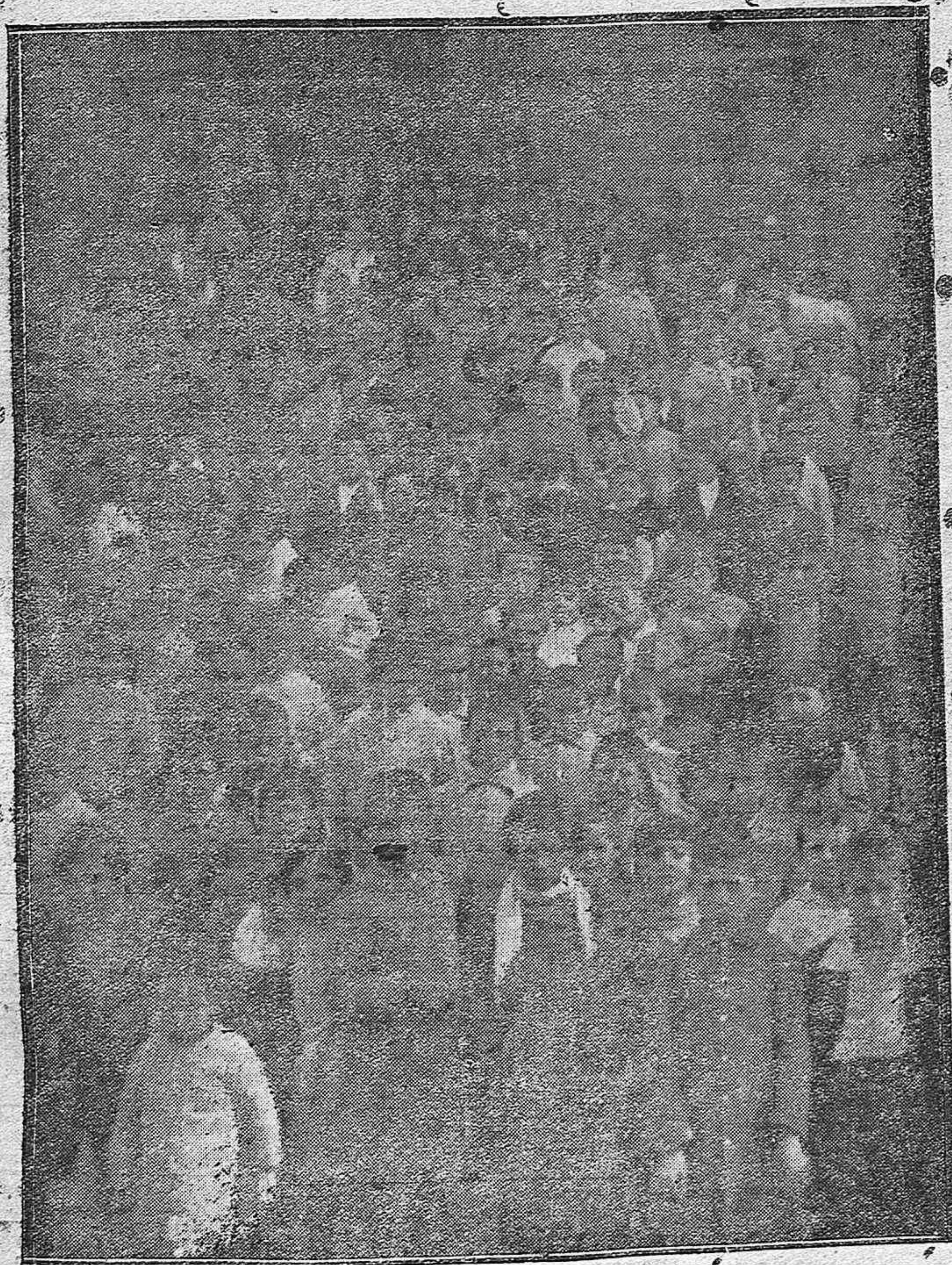
De las actuales misiones para niños que se están celebrando en la parroquia de Santa Marina.—Aspecto de la salida.