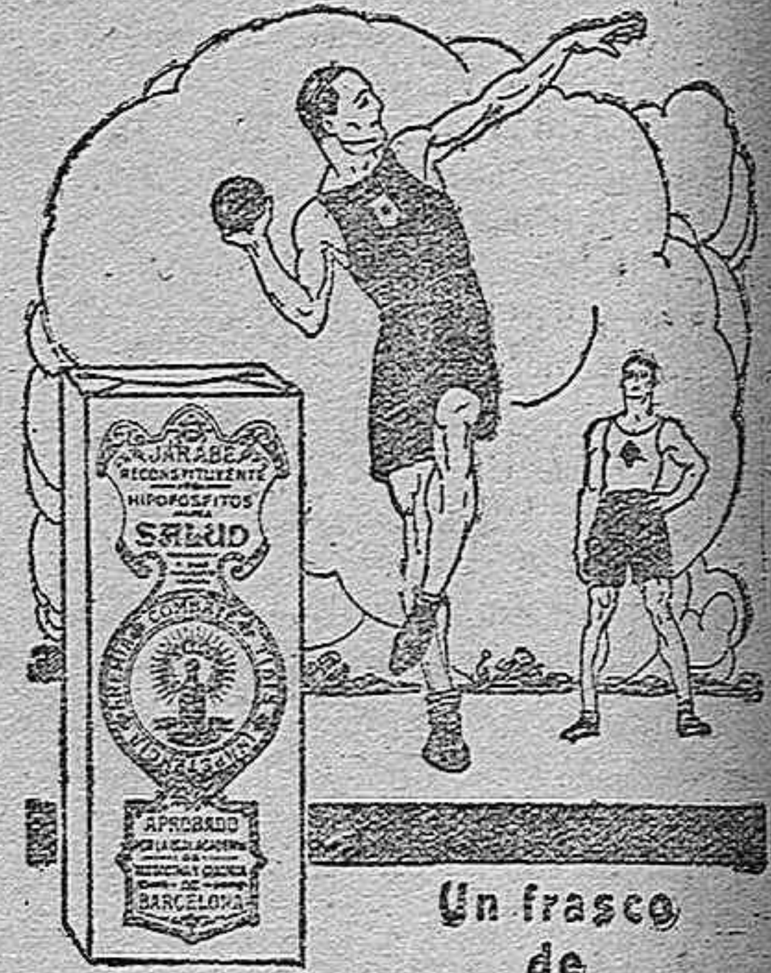
Un frasco de

Con los arreglos introducidos en el nuevo texto los pequeños comerciantes no figurarán incluidos en la tasa sobre pagos.