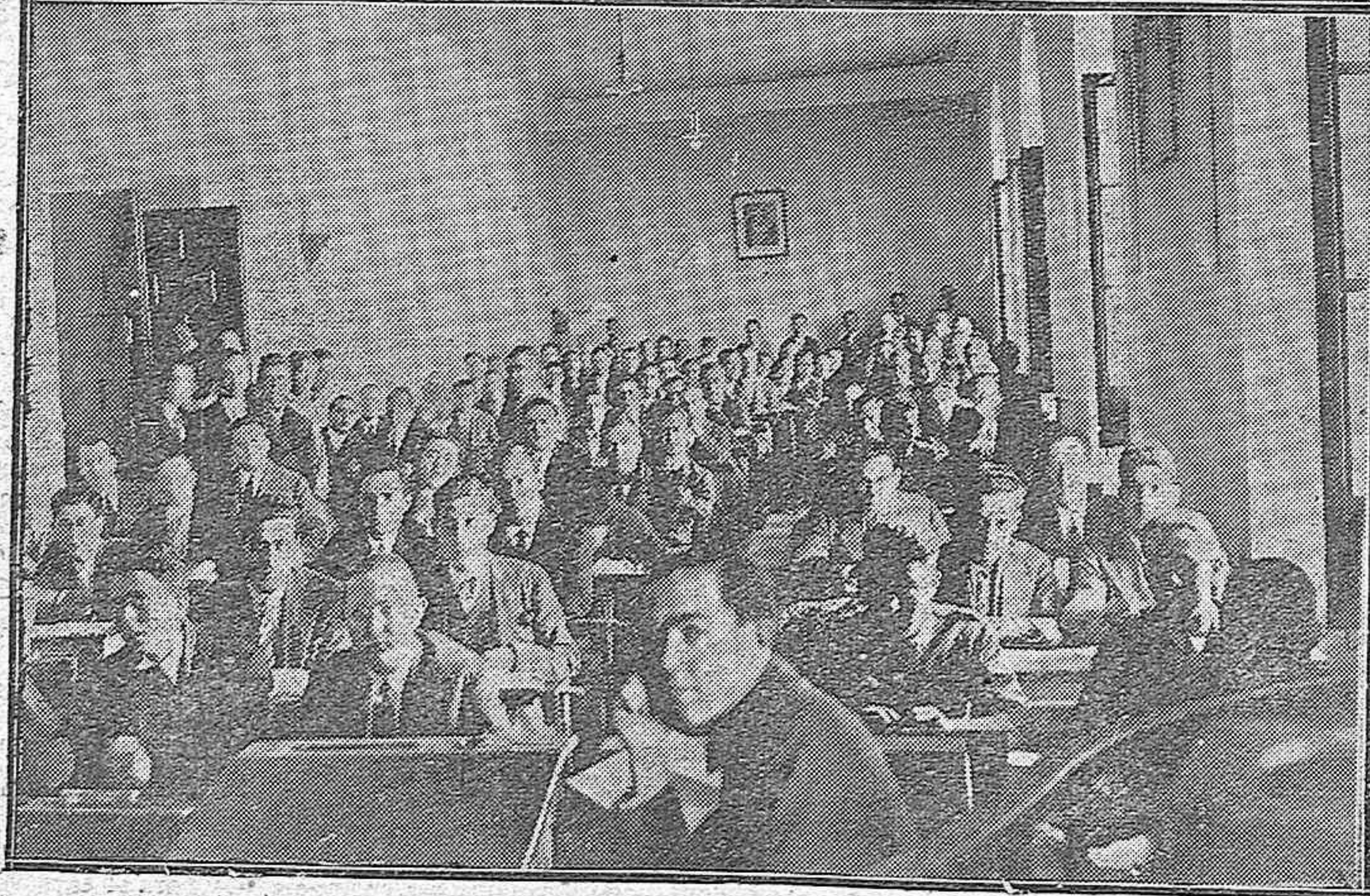
EN LA ESCUELA NORMAL DE MAESTROS.—LAS OPOSICIONES AL MAGISTERIO NACIONAL.—El tribunal calificador de los ejercicios de oposición para plazas del Escalafón de Maestros.—Aspecto del Salón de actos durante el ejercicio escrito.