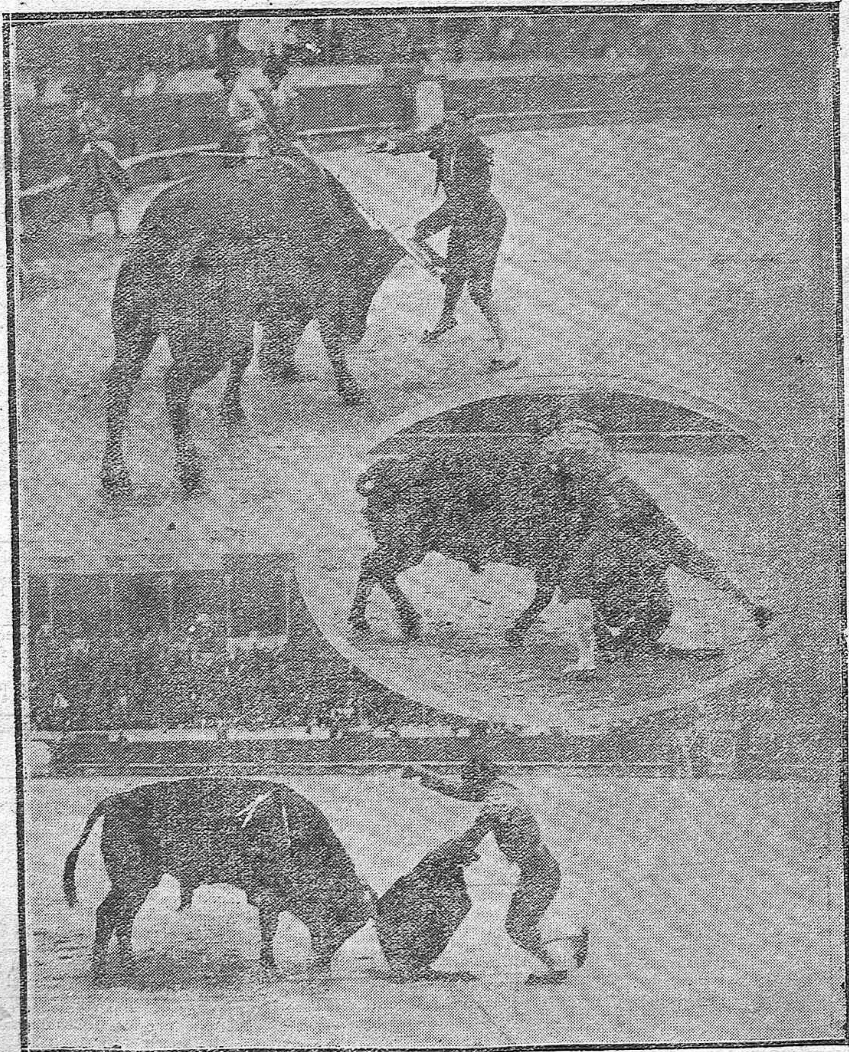
LA NOVILLADA DEL DOMINGO.-Nuestro paisano Cantimpías en el toro de la creje.-Gitanillo de Triana en el soberbio estoconazo al quinto toro.-Angelillo, imitando a Chicuelo.