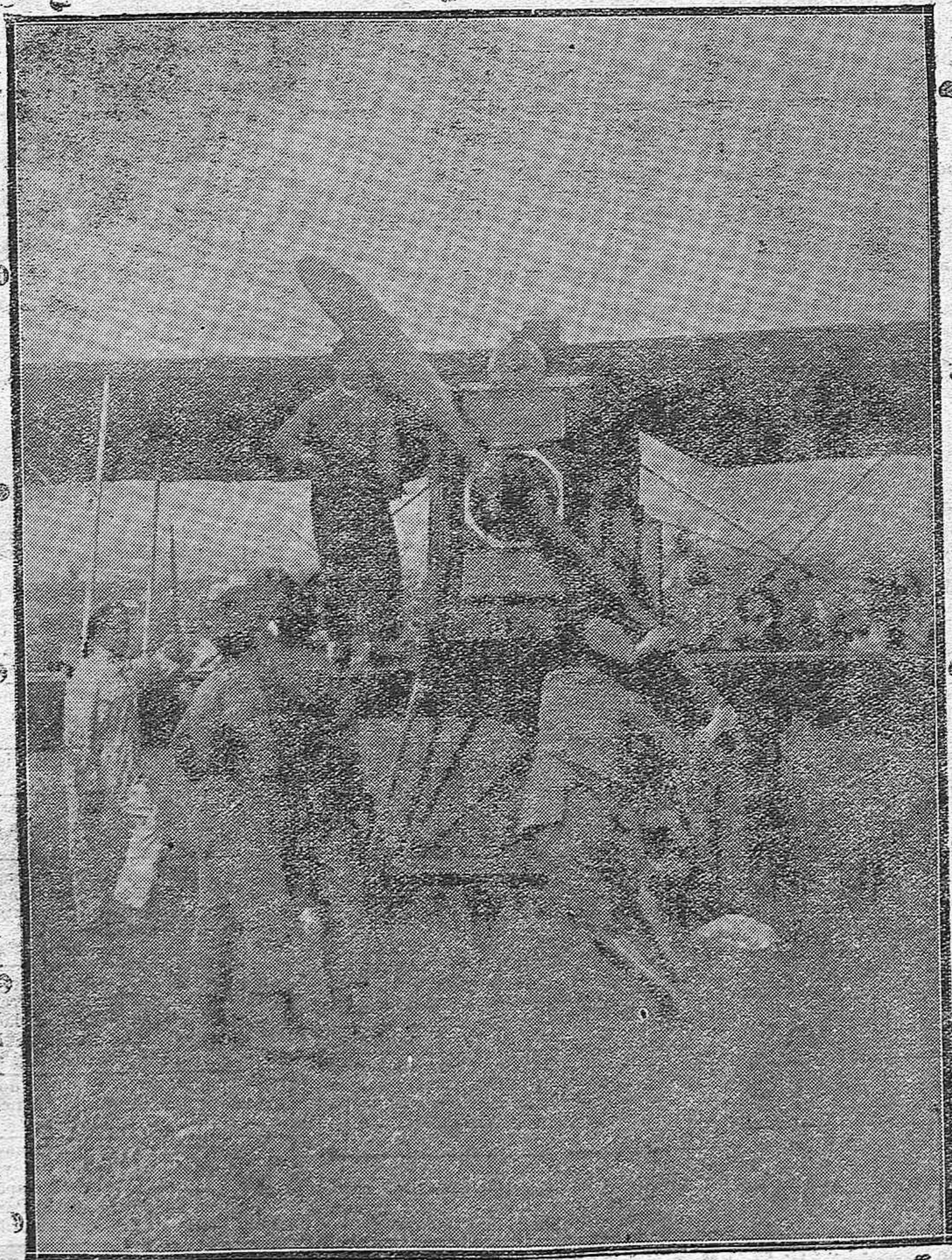
Uno de los aparatos que atterraron en Córdoba, para reparar averías en los que las han sufrido a su regreso a Sevilla y Marruecos.