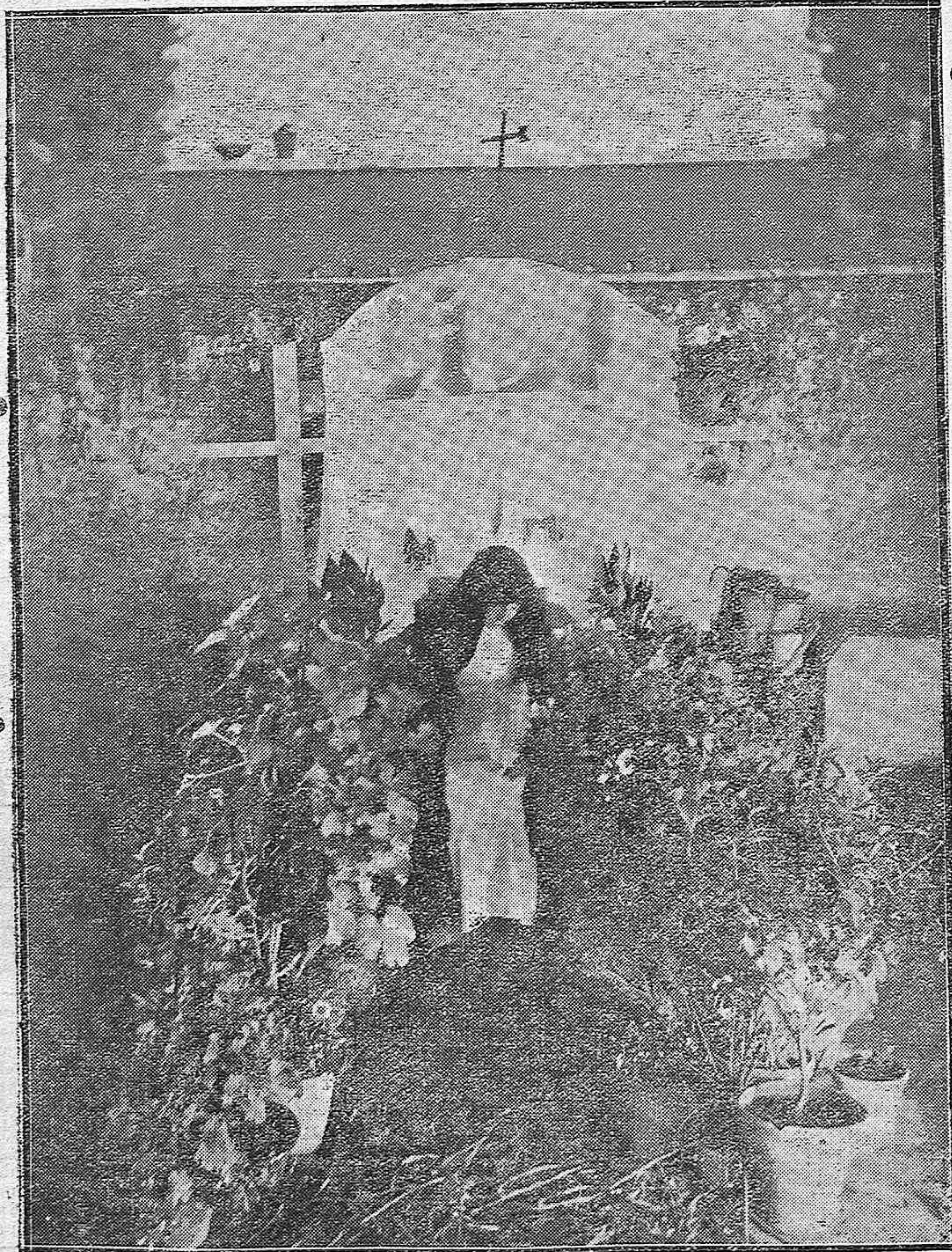
Artístico y modesto altar instalado en una pobrísima casa de la calle Navas de Tolosa, que mereció el premio extraordinario del Ayuntamiento.