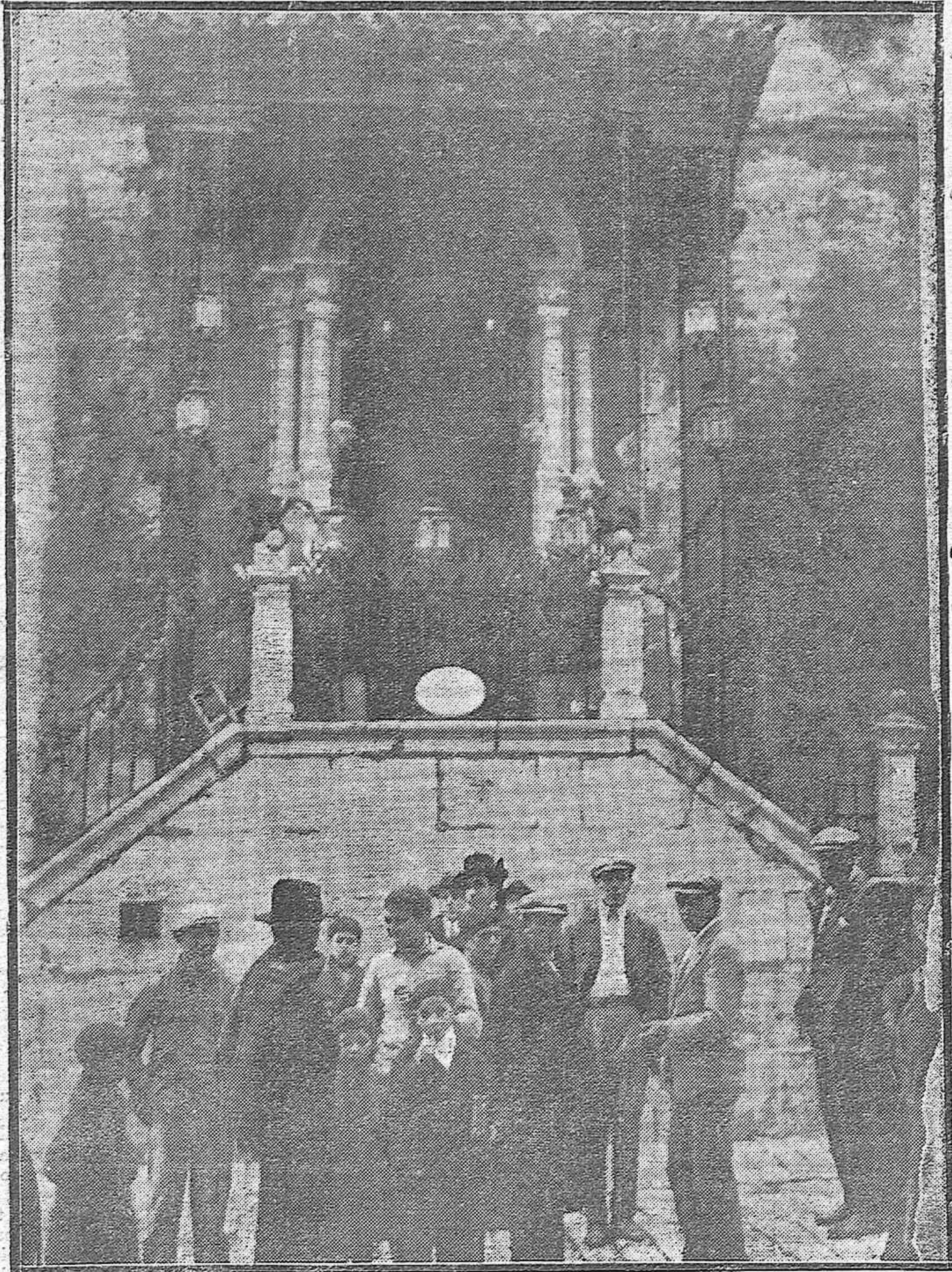
DEL FUEGO DE ESTA MADRUGADA-ASPECTO DE LA VENERADA HORNACINA DE LA VIRGEN DE LOS FAROLLES DESTRUIDA EN SU INTERIOR, DESAPARECIENDO EL VALIOSÍSIMO CUADRO DE LA MILAGROSA VIRGEN, OBRA DEL IMMORTAL PINTOR ITALIANO POMPEYO. DATA ESTE CUADRO Y ESTE CULTO EN EL RECINTO DE LA MEZQUITA CATEDRAL DESDE EL SIGLO XVIII.