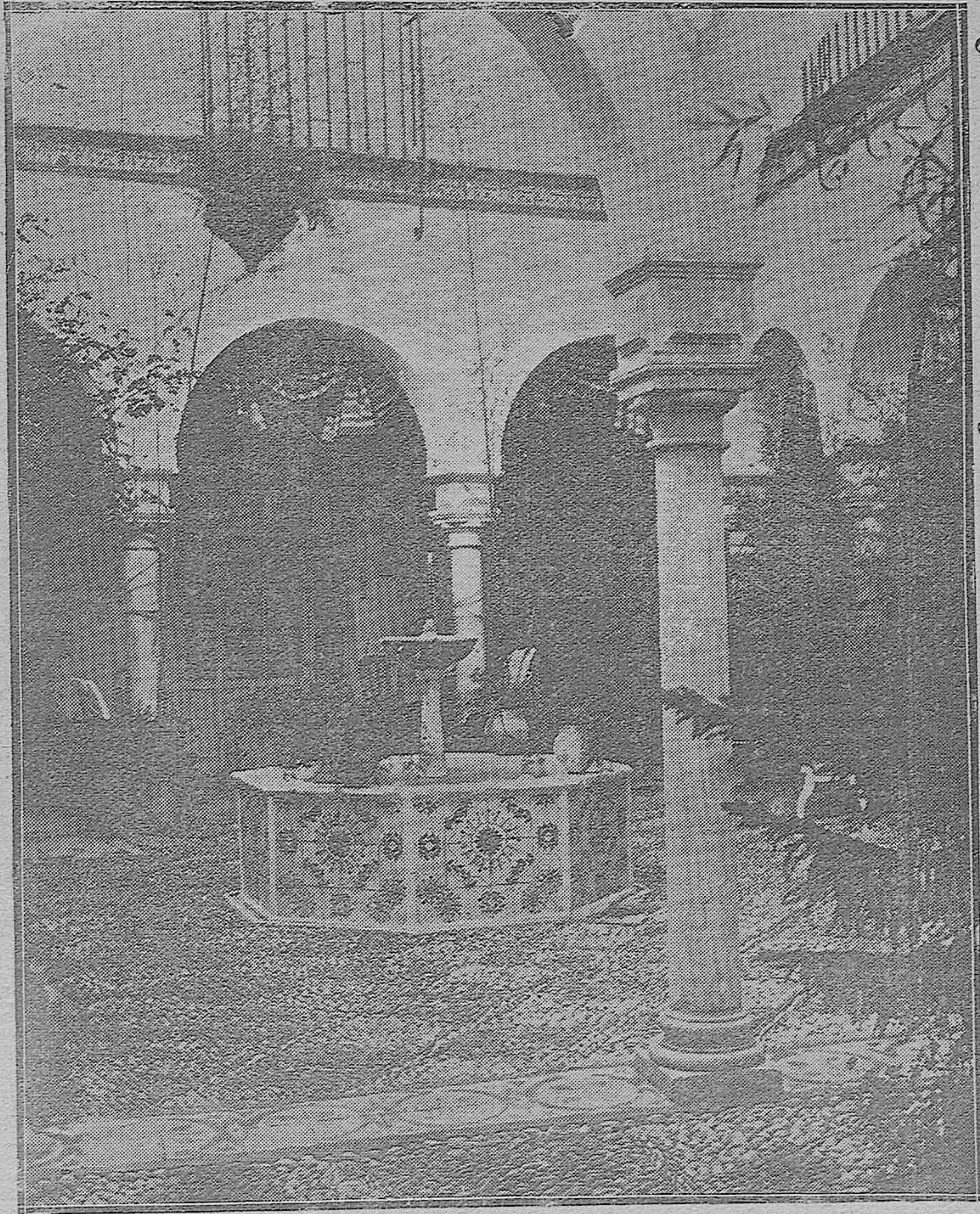
GALERÍA DE PATIOS CORDOBESES. — Uno de los más bellos patios de Córdoba. Es de la casa de la señora viuda de Herrero, en la calle Cabezas, número 16.