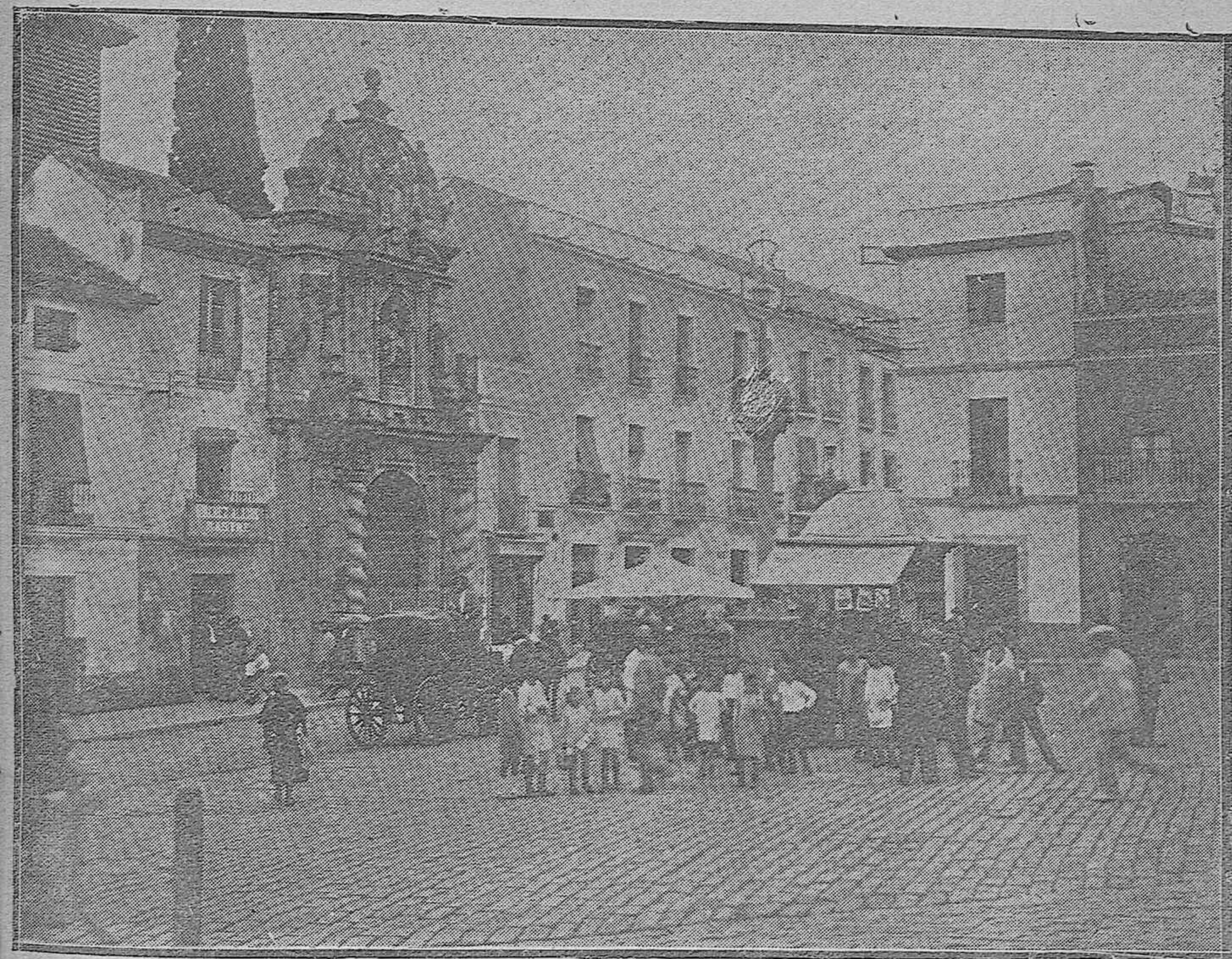
Una vista de la plaza del Salvador en las primeras horas de la mañana