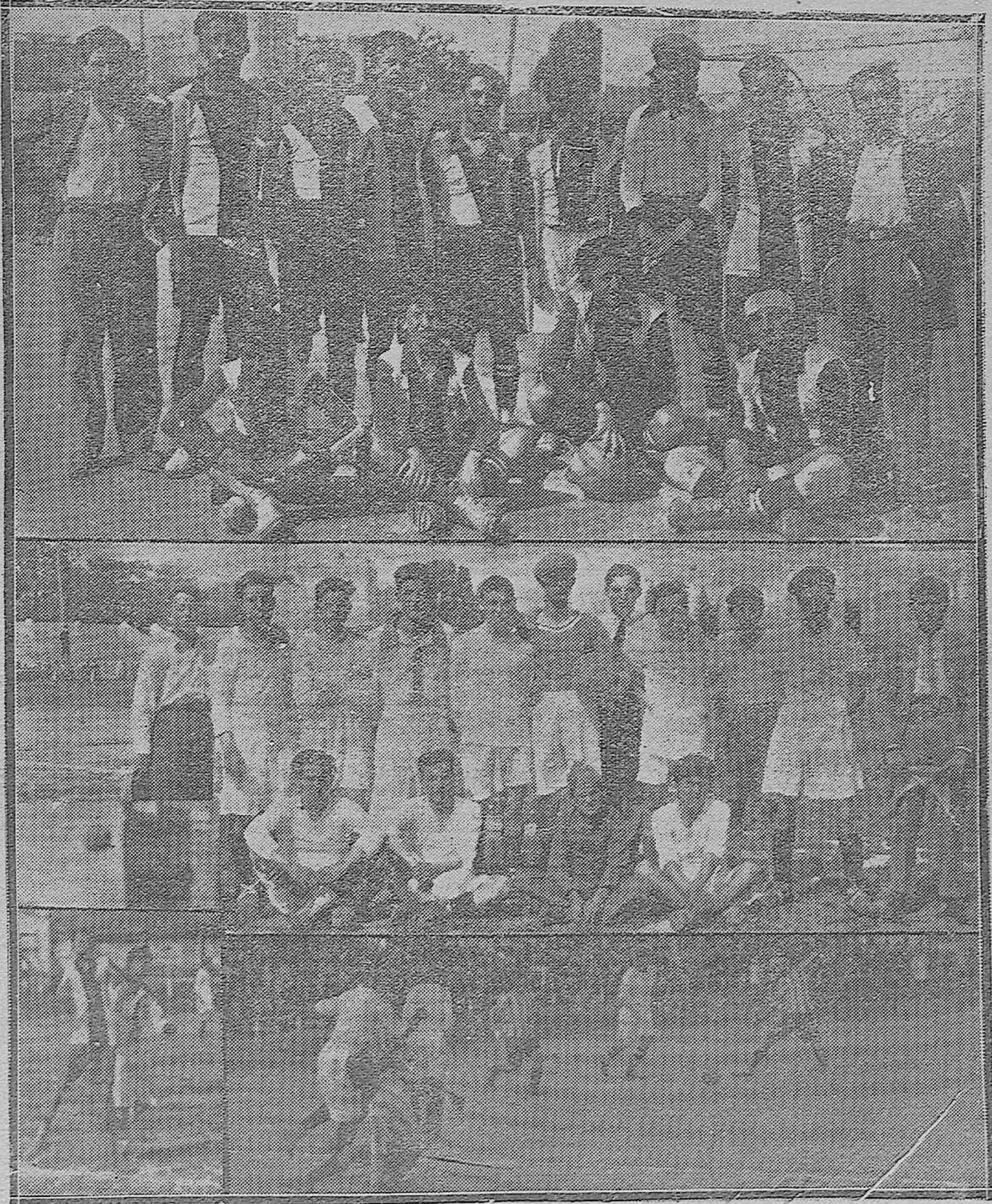
EN EL STADIUM AMERICA.—El equipo «San Hipólito F. C.», que venció por dos tantos a uno al equipo infantil del «Real Sporting Club».—Un momento del encuentro, y otro del importante partido «Real Sporting Club» y el «Industria F. C.», de Sevilla.