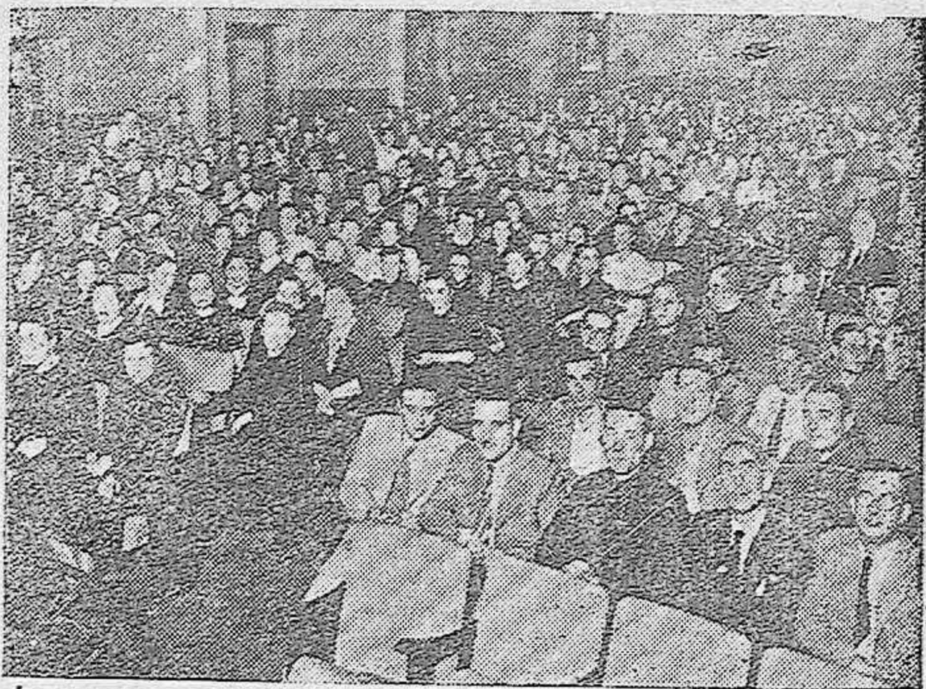
Aspecto de la Sala del Cine Góngora, durante las conferencias de los Cursillos del Magisterio.

Riga, 7.—Noticias de Varsovia dicen que por radio no cesan de dirigirse llamamientos a la población para que no se deje intimidar por el constante cañoneo que se oye y piden que todos los ciudadanos acudan a construir febrilmente fortificaciones para la defensa de la capital.