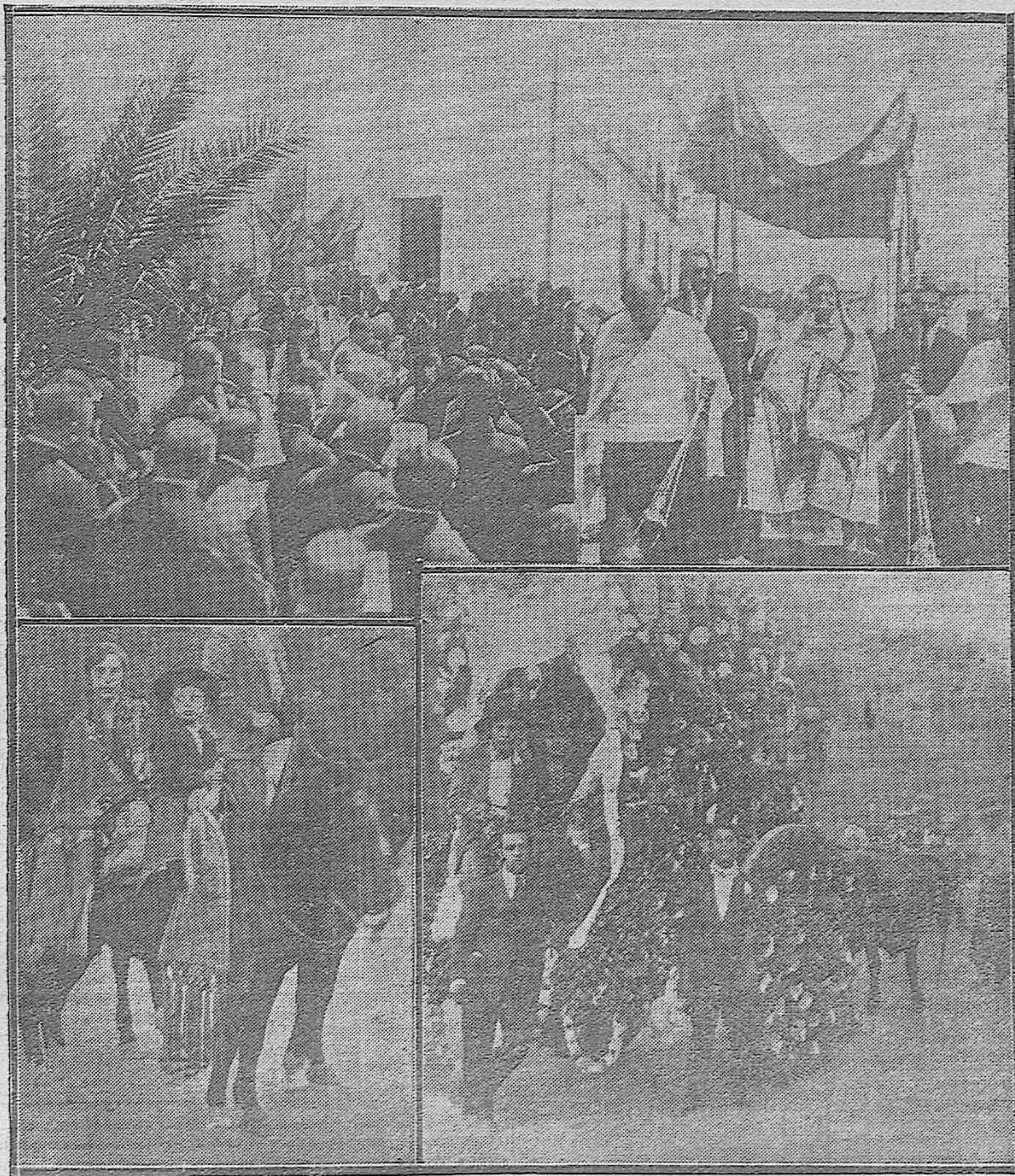
EN EL HOSPITAL DE CRÓNICOS: Dos aspectos de la ceremonia celebrada con motivo de administrar la comunión Pascual a los enfermos y acogidos en el establecimiento benéfico.--DE LA ROMERÍA AL SANTUARIO DE LINARES: Una de las parejas a caballo que fueron premiadas. Carro adornado que obtuvo el primer premio.