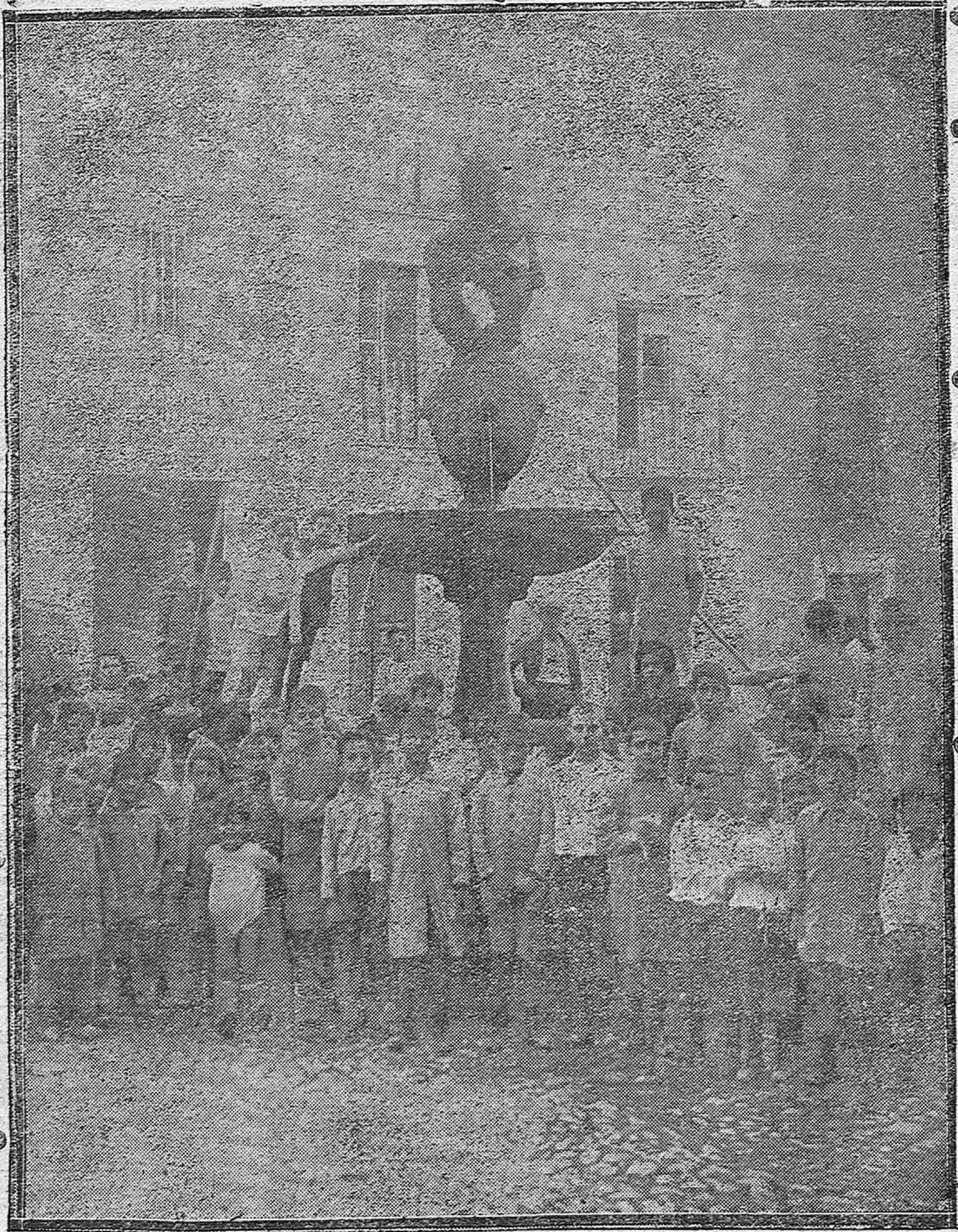
EL DÍA DEL LIBRO.—Alumnos de las escuelas visitando el histórico paraje del Potro, citado por Cervantes en «El Quijote».