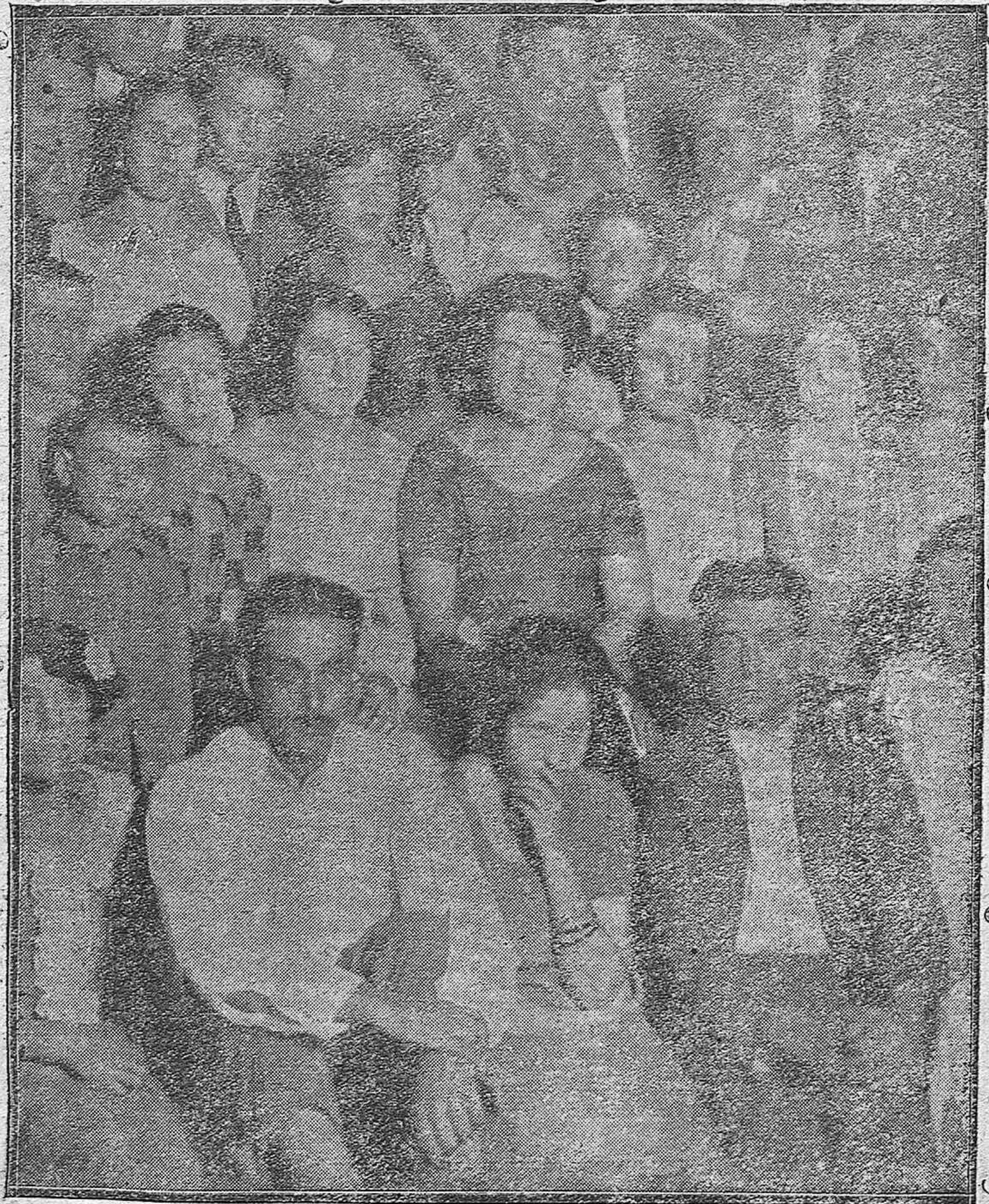
Grupo de asistentes a la verbena celebrada en el Huerto de San Agustín.