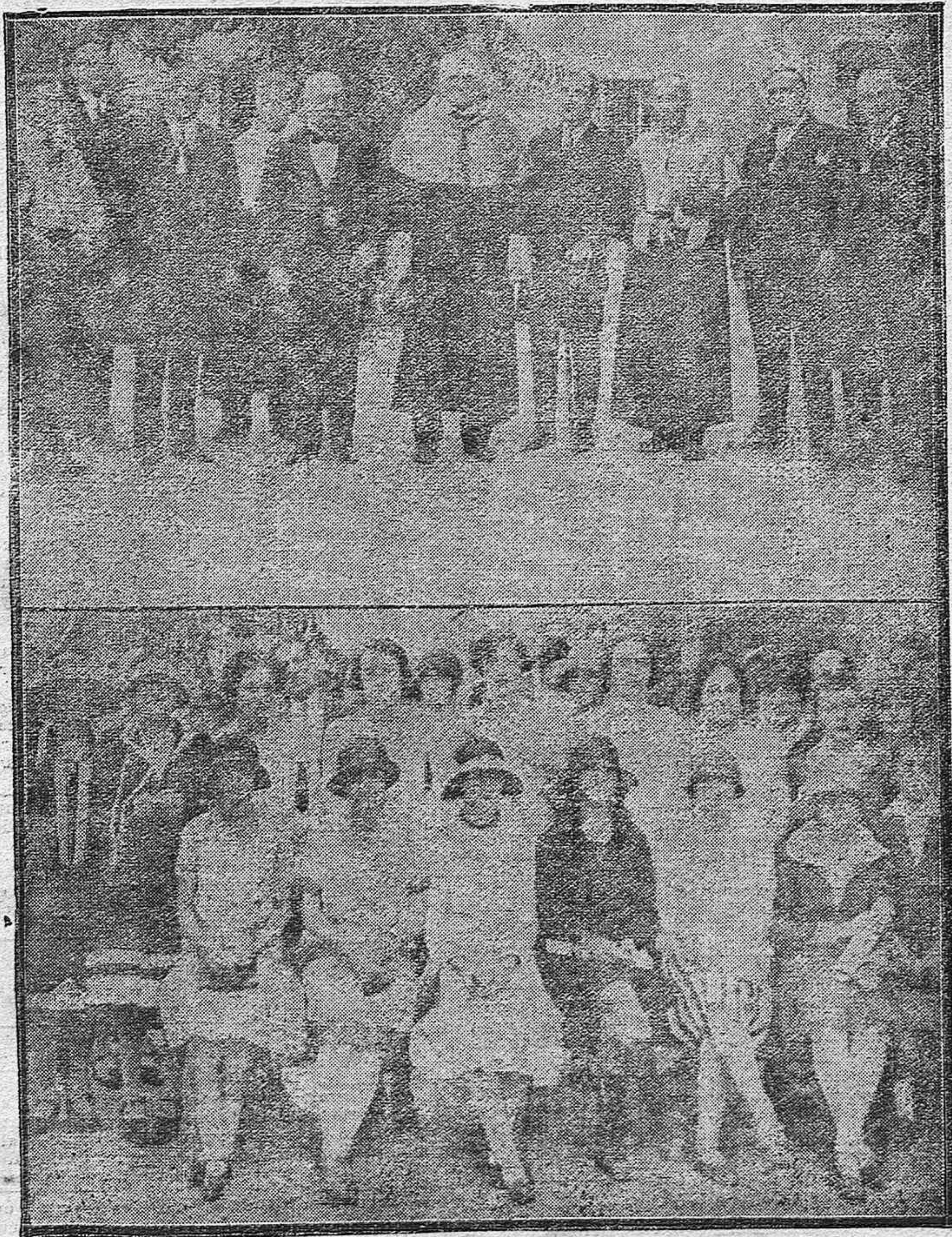
1.º Apertura del Curso escolar. El Director del Instituto de 2.ª Enseñanza con las autoridades y Directores de Centros docentes oficiales al terminar el acto.—2.º Distinguidas y bellas señoritas que fueron premiadas en tan solemne acto.