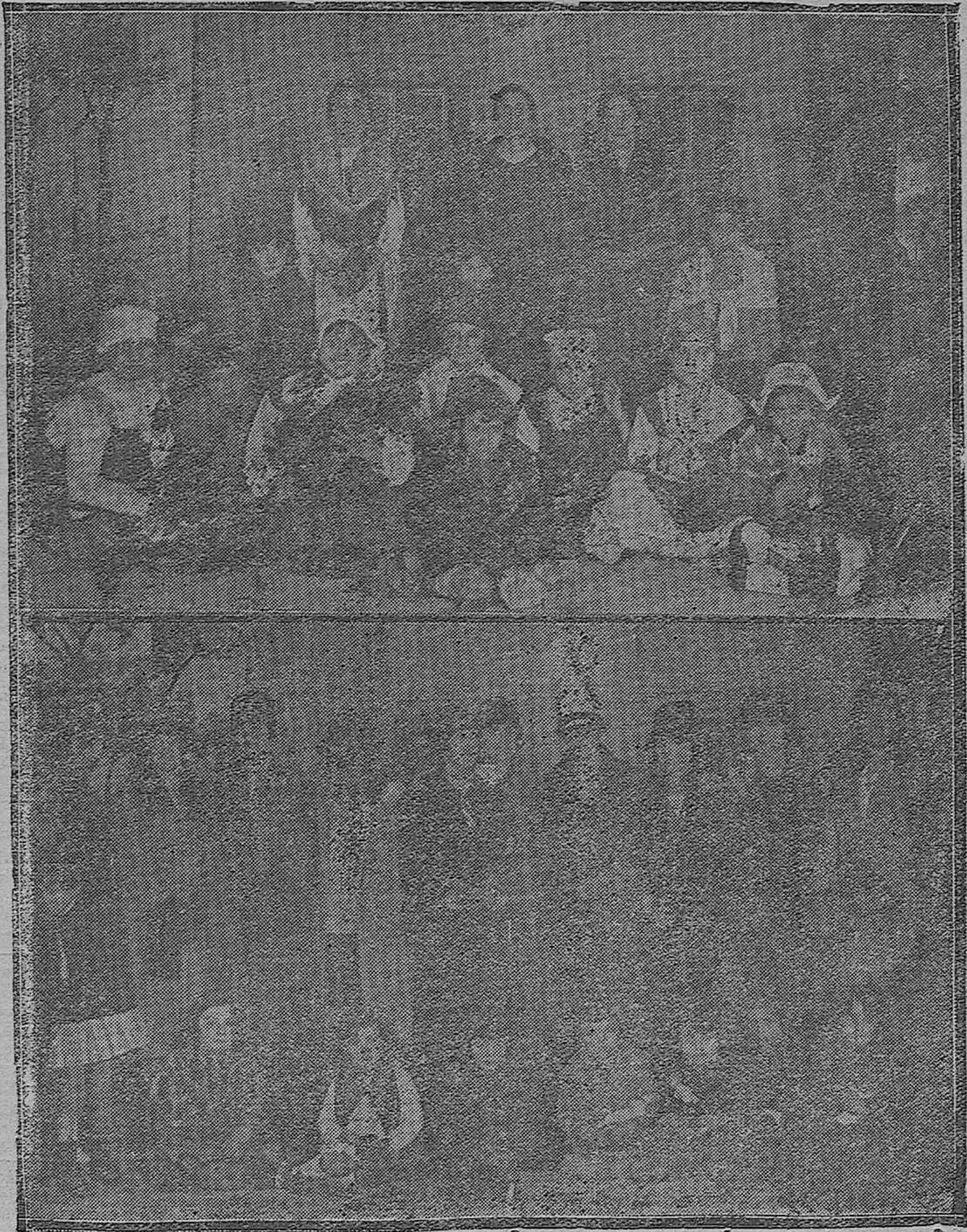
EN LAS ESCUELAS DEL SAGRADO CORAZÓN DE JESÚS.—Preciosas niñas que tomaron parte en la velada teatral.—Bellas señoritas que forman la asociación de María Inmaculada que confeccionaron ropas para regalárselas a las niñas pobres que asisten a estas escuelas.