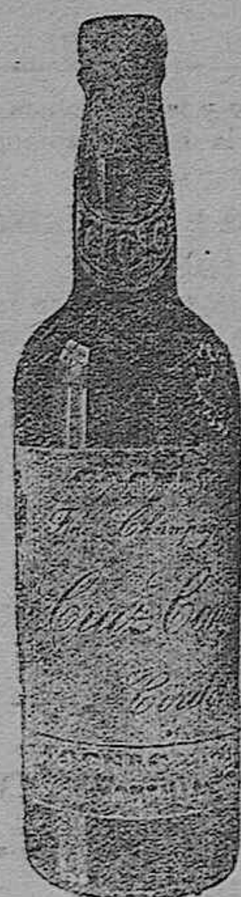
Coñac Cruz Conde

Juanetas, durezas. Use sin demora UN- GUENTO MÁGICO tres días. Es radical. Farmacias, droguerías, 1'50.