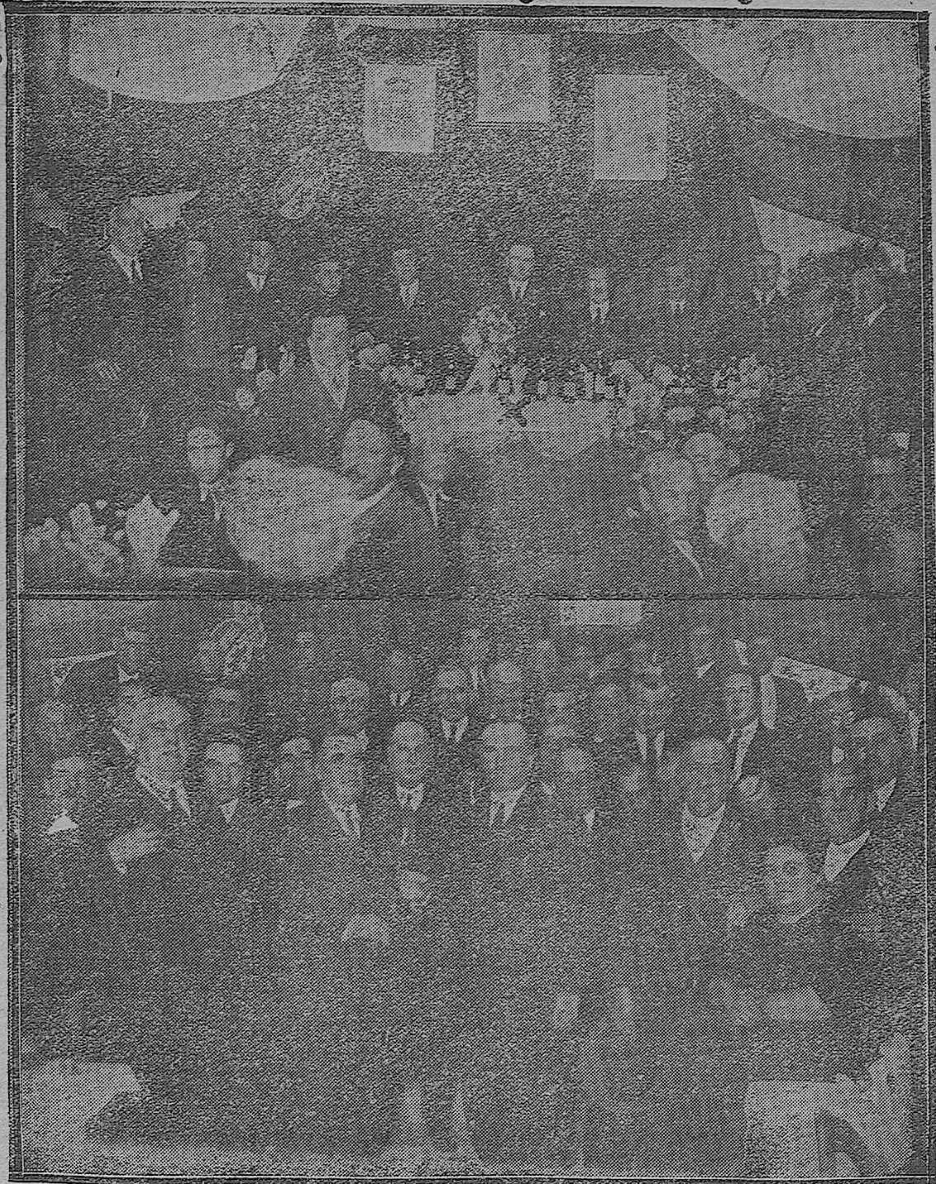
HOMENAJE AL ALCALDE DE ESPEJO.—Banquete con que fué obsequiado por su beneficiosa labor.—Entrega de un bastón de mando que le ha sido regalado por suscripción popular.