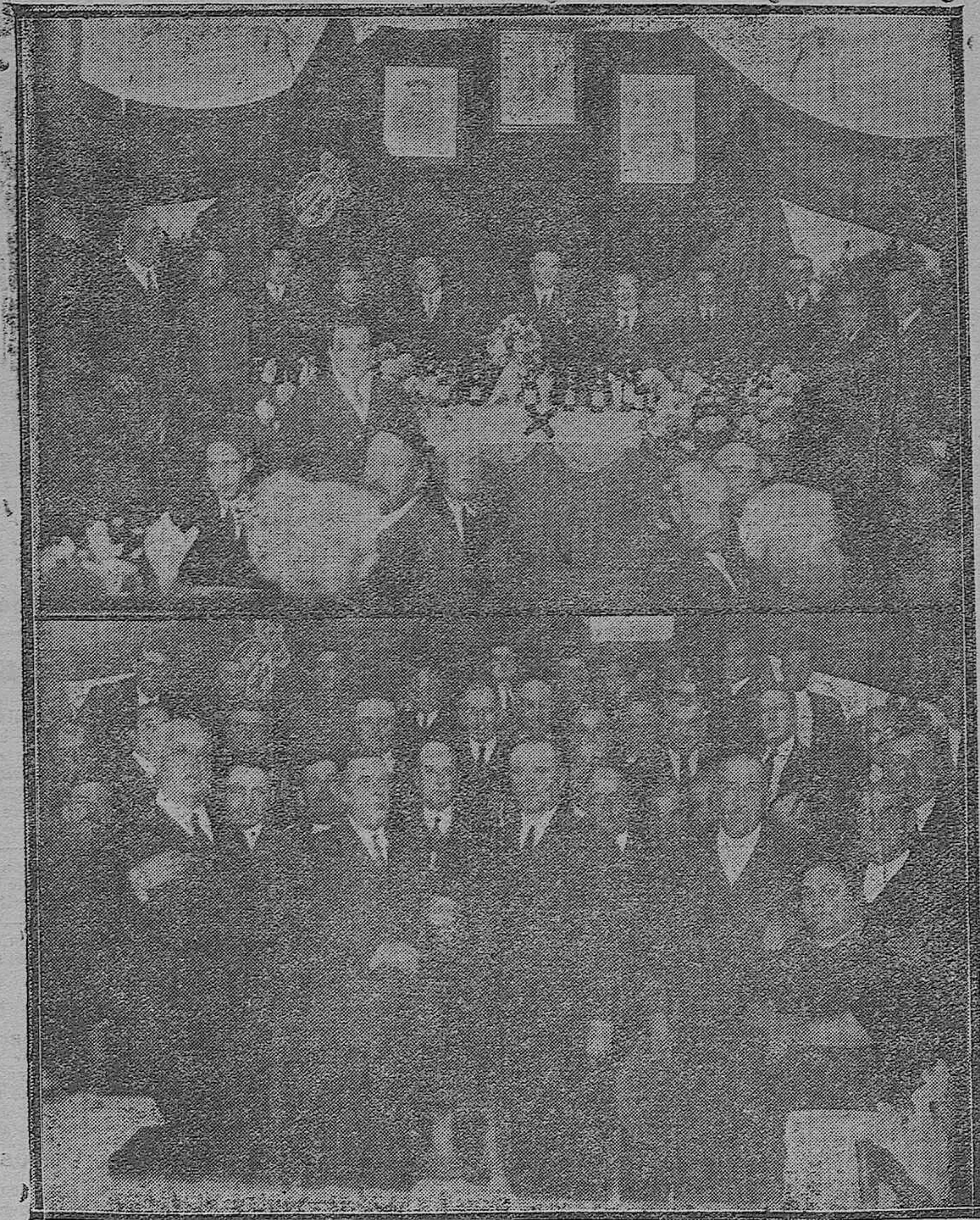
HOMENAJE AL ALCALDE DE ESPEJO.—Banquete con que fué obsequiado por su beneficiosa labor.—Entrega de un bastón de mando que le ha sido regalado por suscripción popular.