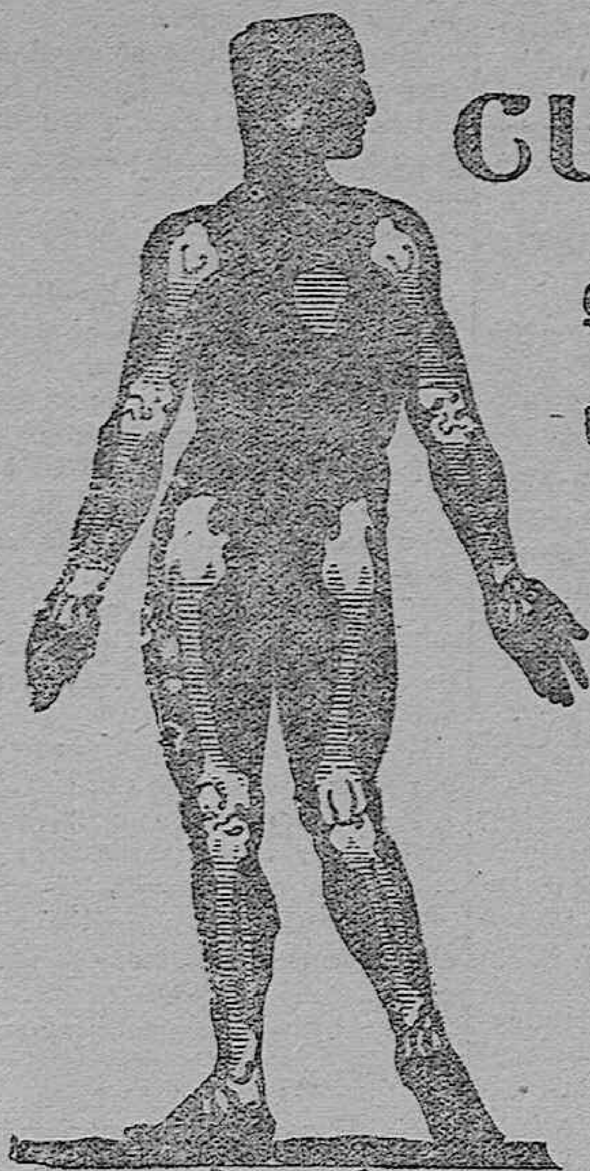
Gráfico indicador de los puntos donde se sitúa el reuma

El reuma se localiza principalmente en los puntos indicados en este grabado y se manifiesta con dolores agudos en los huesos, articulaciones y músculos, hinchazón en la parte dolorida, dificultad al andar y moverse, punzadas, falta de apetito, pesadez, jaquecas, sofocaciones, rojeces en la piel, frío en las extremidades, sensibilidad a los cambios atmosféricos, etc. EL URODONAL hace desaparecer a las pocas tomas la mayoría de estas molestias y sufrimientos, que imposibilitan la vida ordinaria, y cura definitivamente y con rapidez no igualada la raíz del mal y sus funestas consecuencias en todos sus grados.