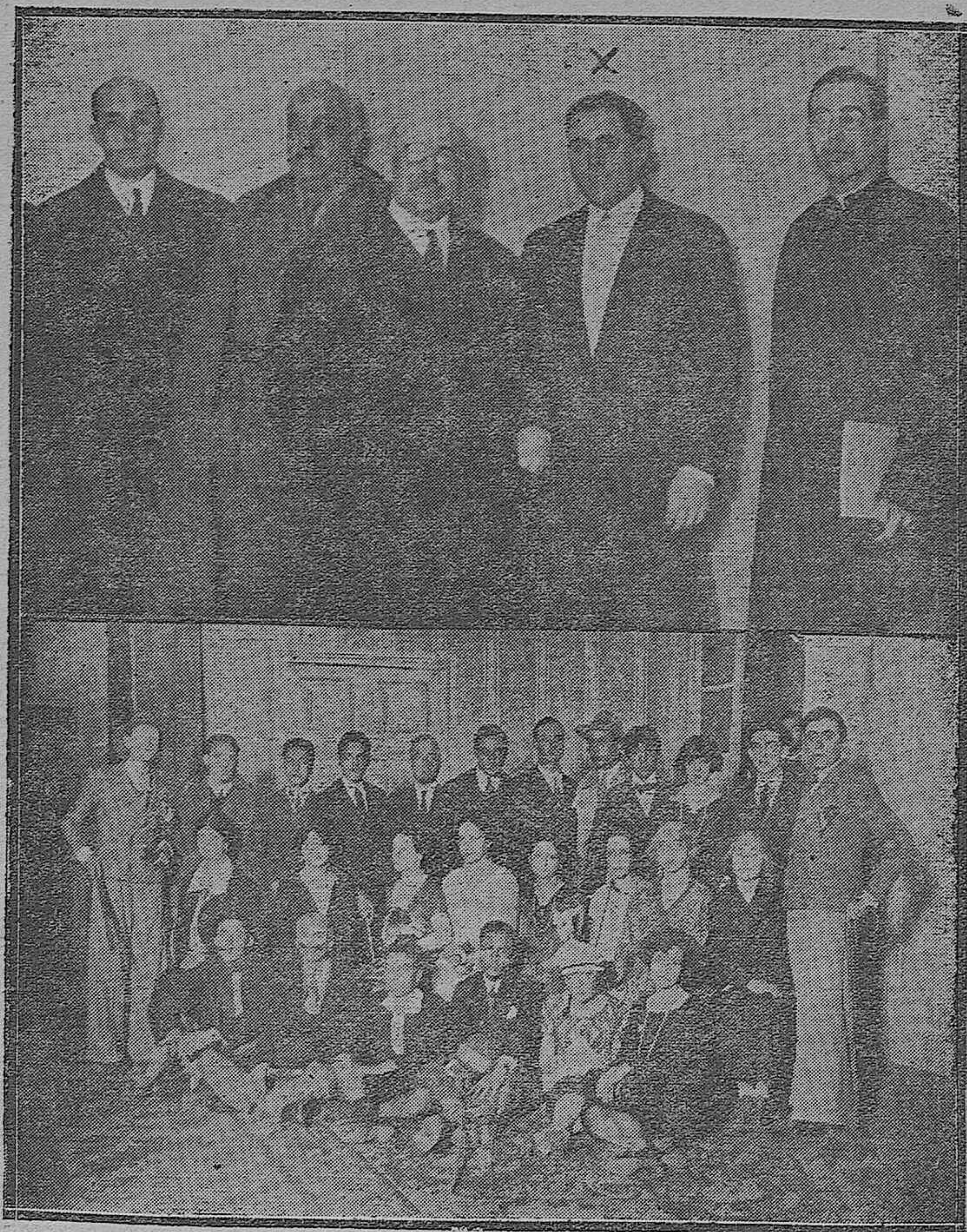
Don Antonio Bermúdez Cañete, al terminar la notabilísima conferencia sobre el tema «El problema de la industrialización en España», en la Real Academia de Ciencias.— Distinguidos jóvenes de la 'buena sociedad' cordobesa que tomaron parte en la función a beneficio de los damnificados de Cuba, celebrada en el Gran Teatro.