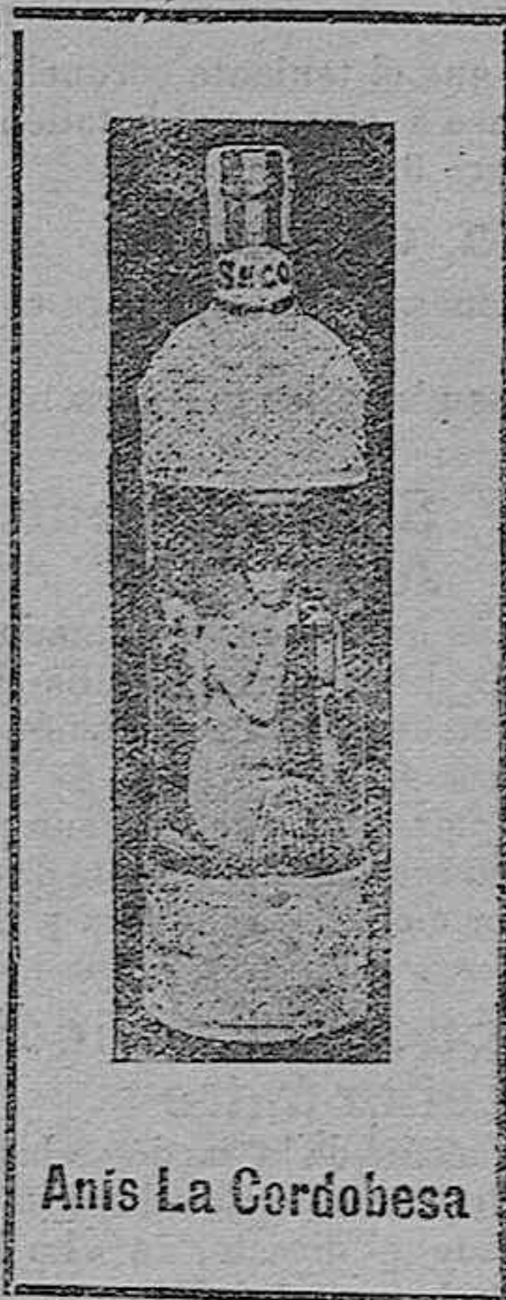
Anís La Cordobesa