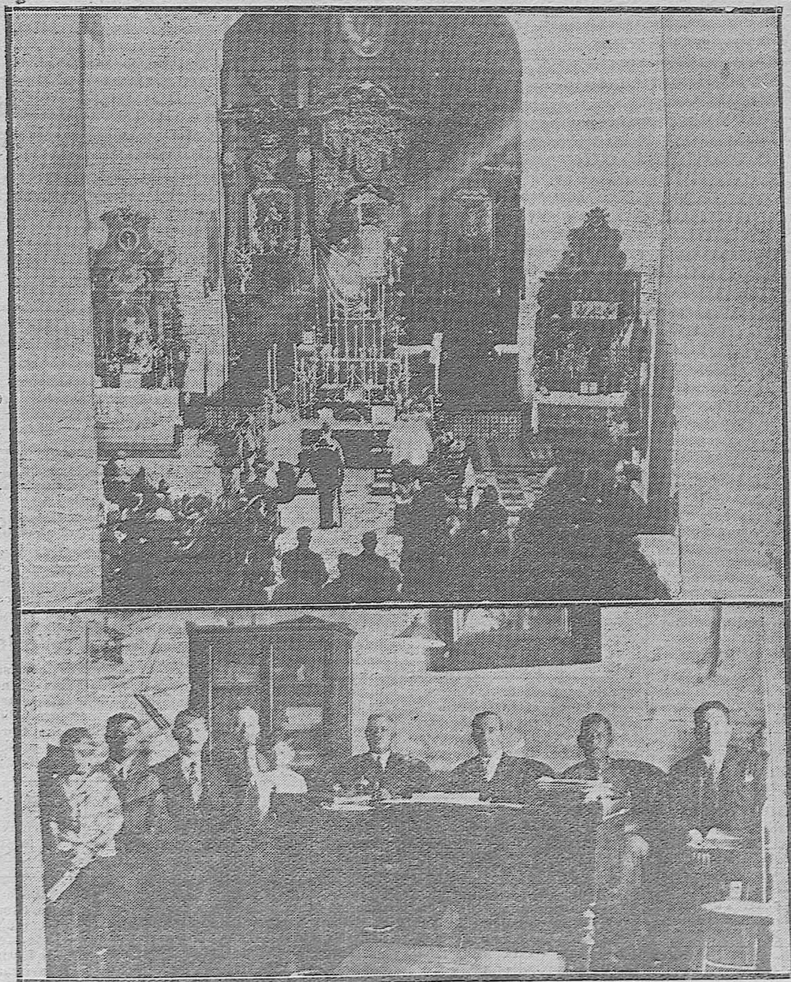
ALMODOVAR DEL RIO.—Aspecto del altar mayor de la parroquia durante la solemne misa de Requiem por los soldados fallecidos en Marruecos.—Las autoridades al terminar el reparto de meriendas con que fueron obsequiados los licenciados del Ejército de Africa.