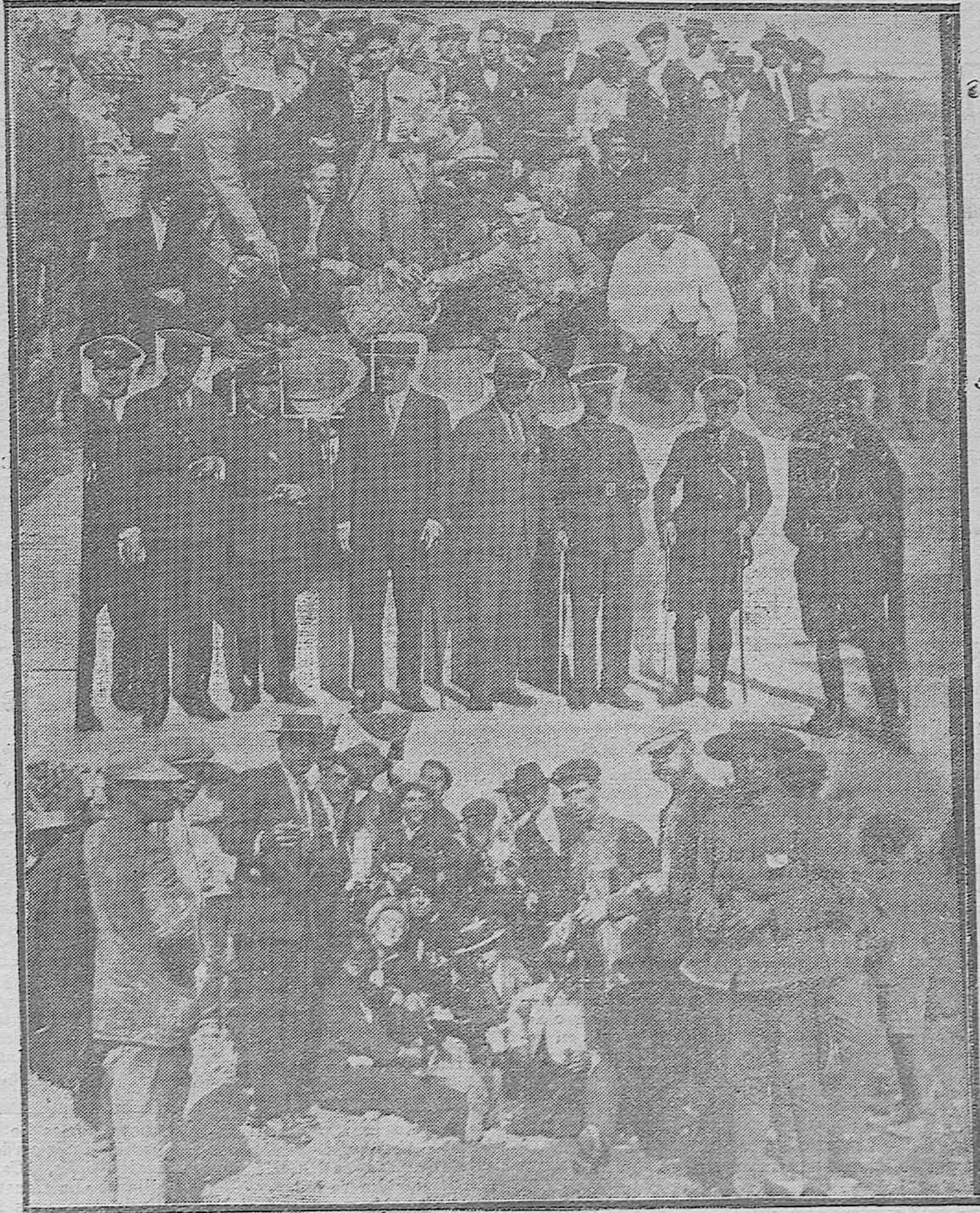
HOMENAJE A LOS LICENCIADOS DE MARRUECOS.— Dos grupos de licenciados durante el clásico perol con que fueron obsequiados en Pedroches.— Las autoridades presenciando la simpática jira.