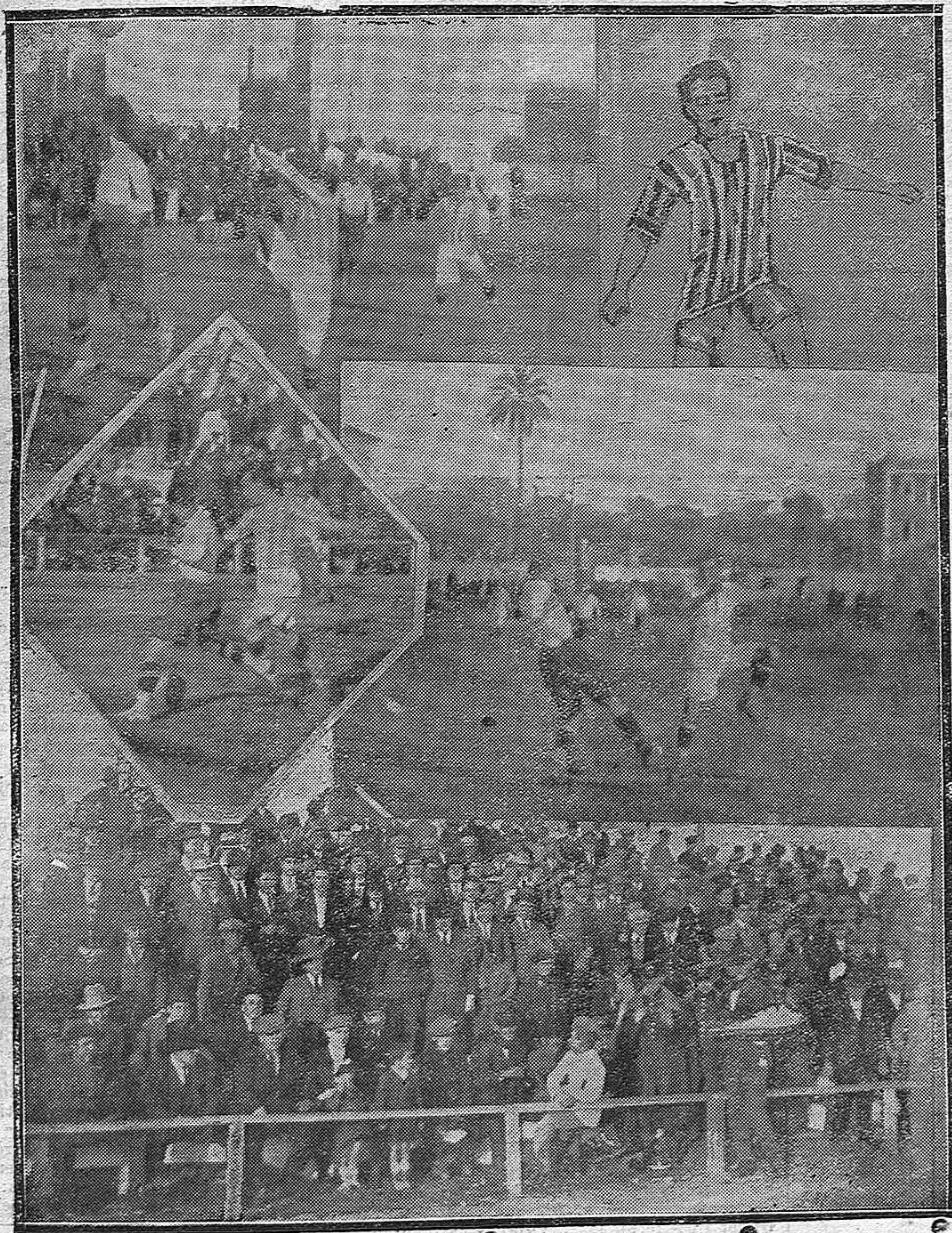
EN EL STADIUM AMÉRICA.—Varios momentos del partido Málaga F. C.-Electromecánica—Parte del público presenciando las jugadas.