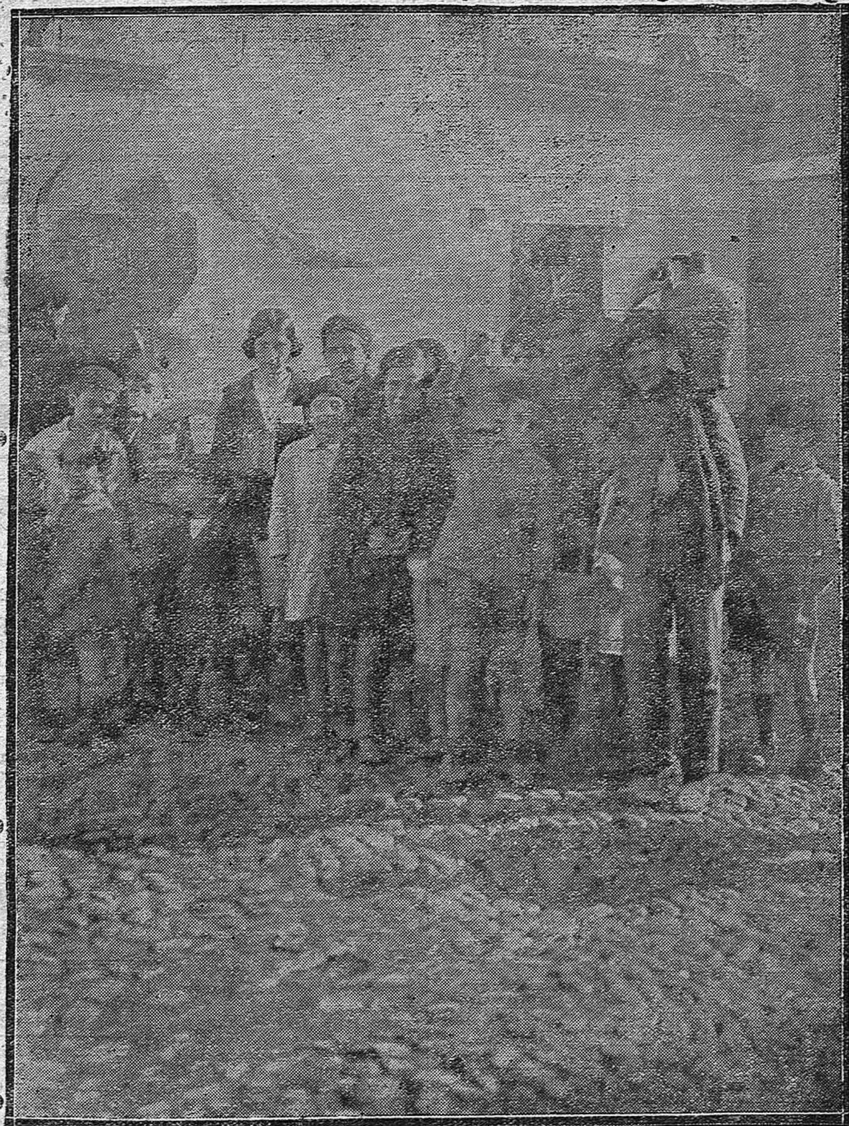
ESCENAS CALLEJERAS.—En la típica plaza de la Fuensanta, en las inmediaciones de la preciosa fuente, un pianillo de manubrio detiene en su marcha a los transeúntes y los agrupa en torno suyo para escuchar los sonos de un pasacalle retozón y alegre